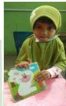
Salah satu anak menunjukkan keberhasilannya menyusun pazzel dengan rasa percaya diri tanpa didampingi oleh orang tua