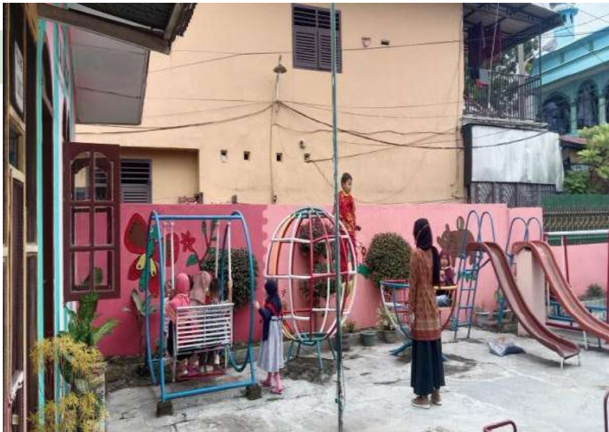
Area bermain anak di TK Al-Kausar