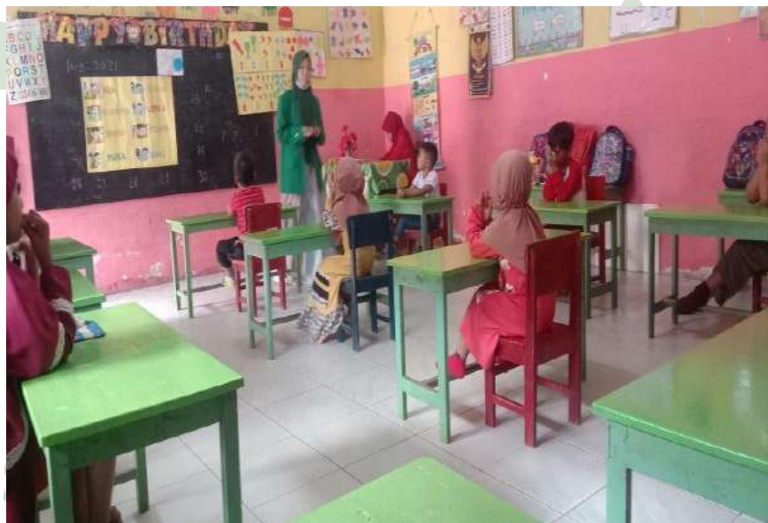
Posisi duduk peserta didik ketika melakukan pembelajaran