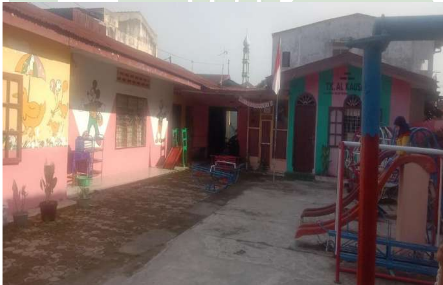
Halaman depan sekolah TK Al-Kausar