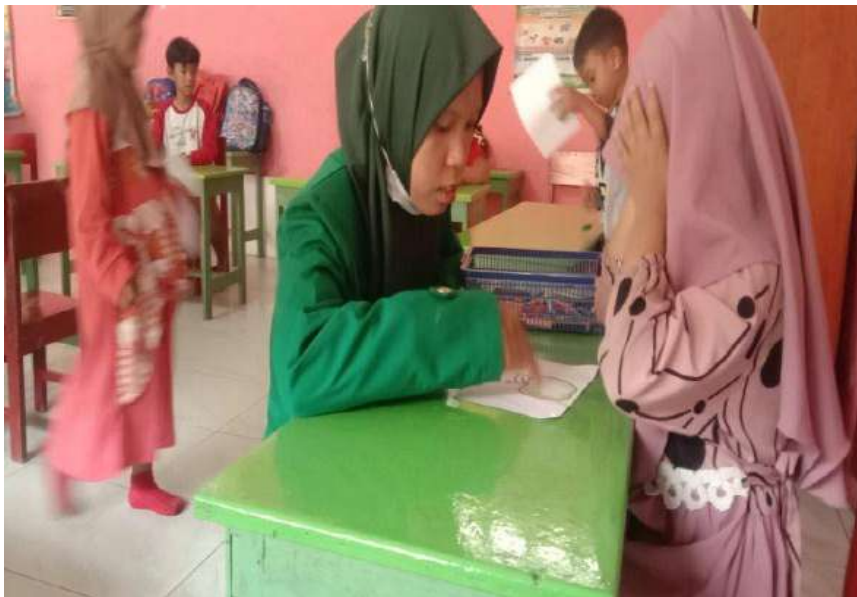
Proses belajar peserta didik di TK Al-Kausar