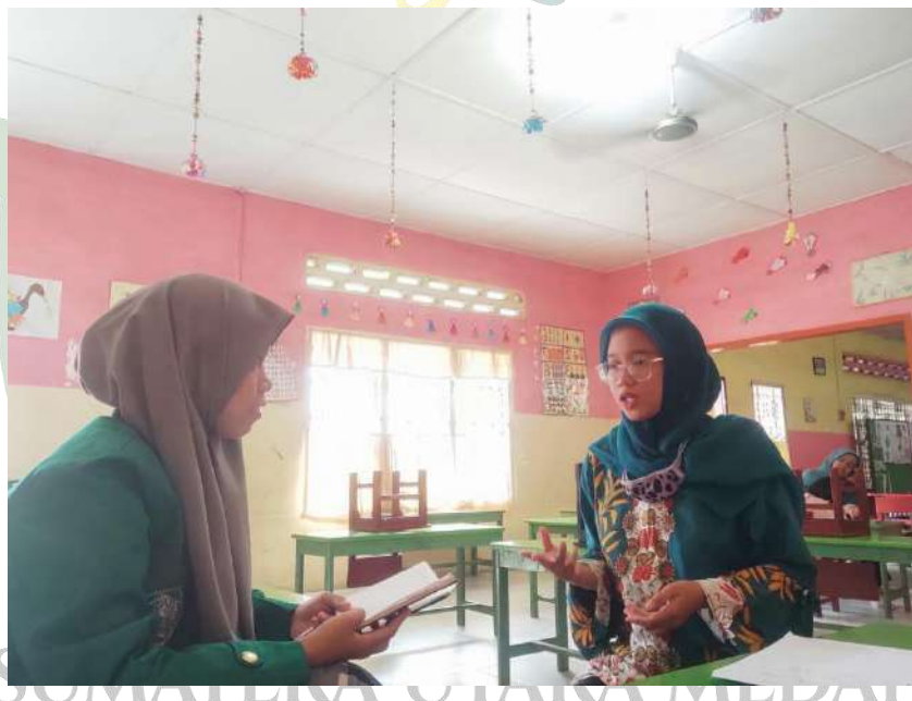
Wawancara dengan kepala sekolah TK Al- Kausar