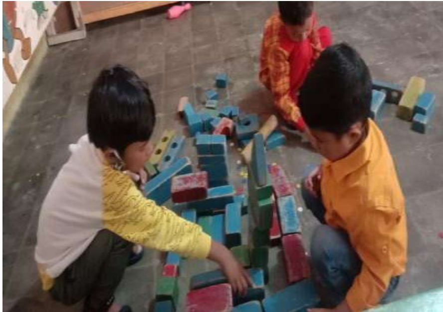
Alat permainan TK Al- Kausar