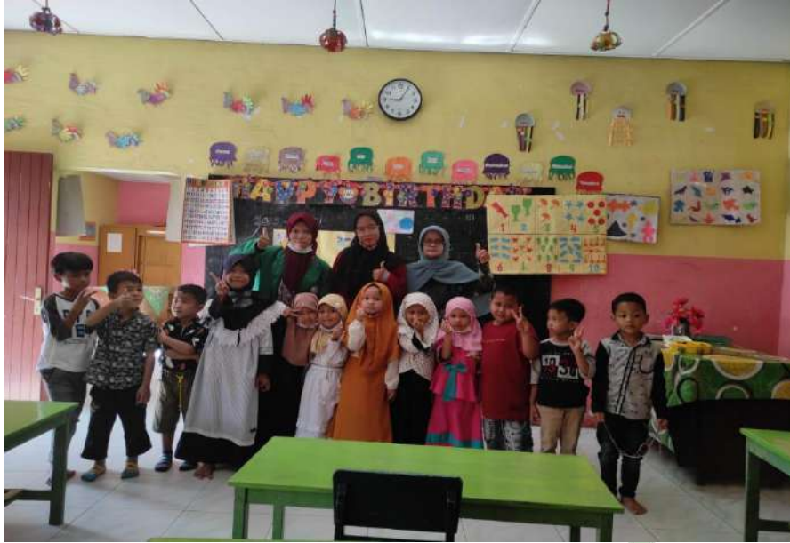
Foto bersama peserta didik dan guru kelas sekolah TK Al- Kausar