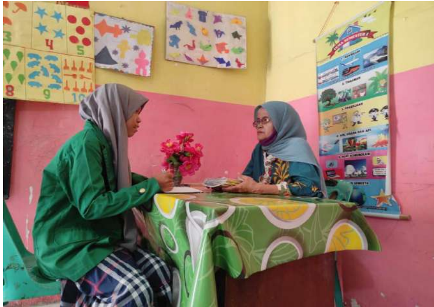
Wawancara dengan guru sekolah TK Al- Kausar