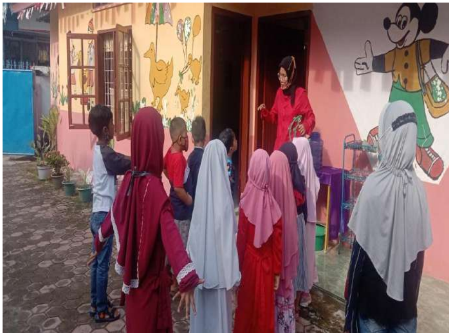
Kegiatan sebelum masuk kelas TK Al- Kausar