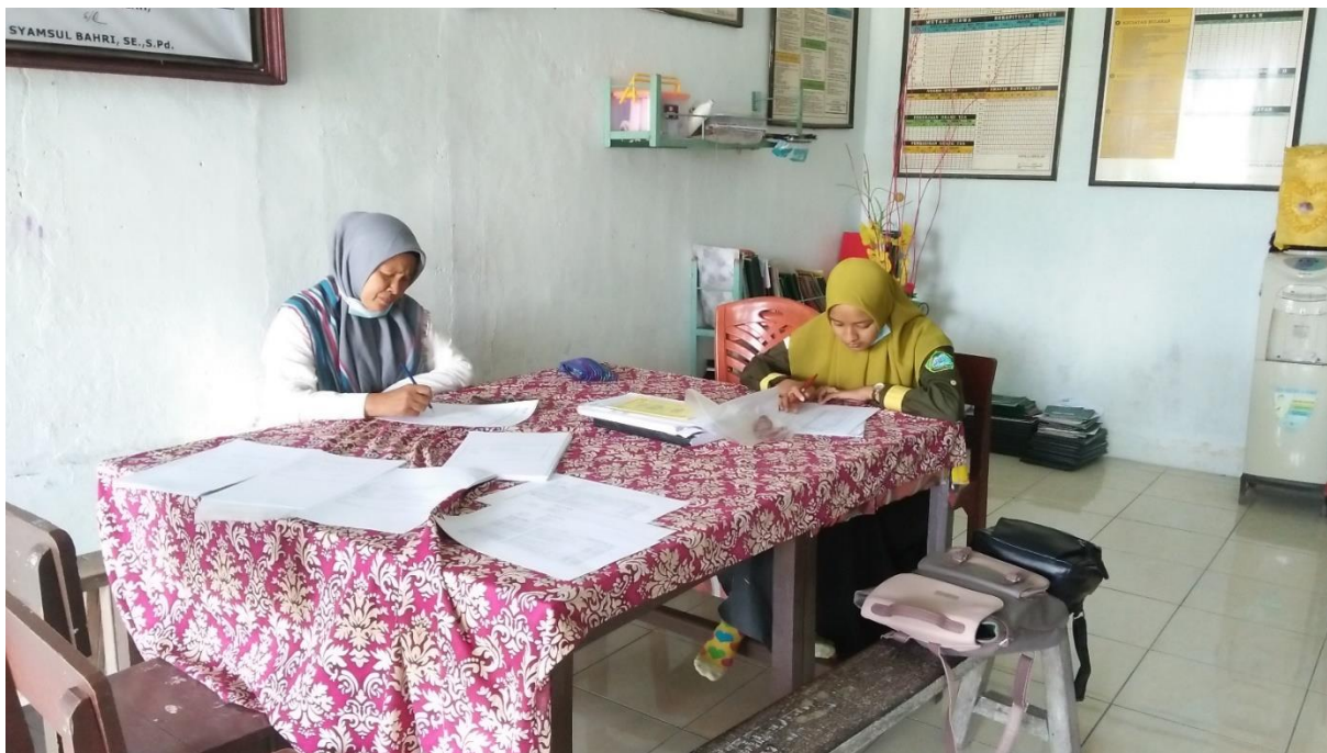
Saling bertukar informasi kepada Ibu RN mengenai Pembelajaran Tematik

Dokumentasi Penelitian di SD Swasta PAB 19 Bandar Klippa