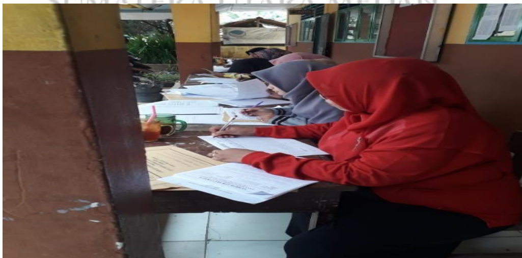
Kegiatan Guru-guru ketika sedang menyusun RPP