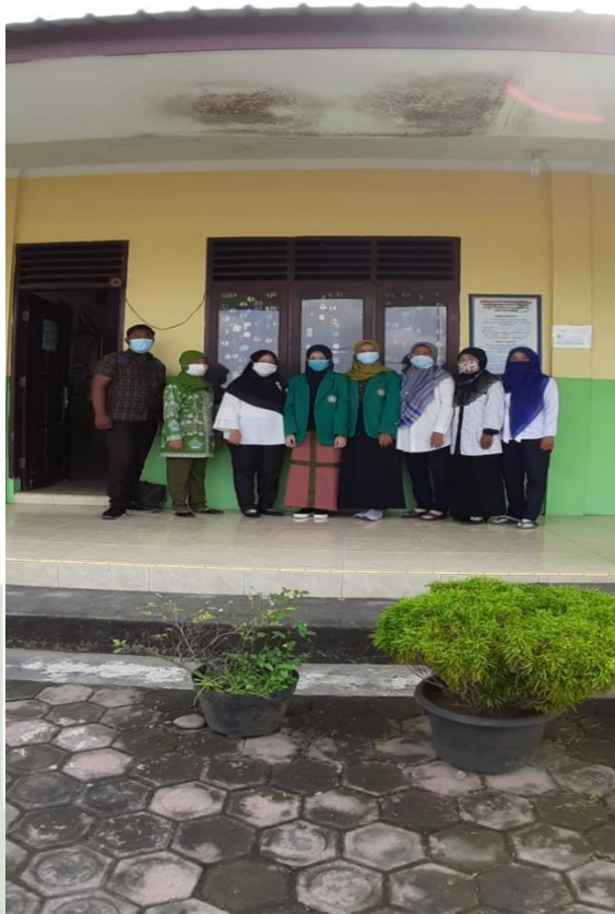
Foto bersama Ibu RN dan Ibu KS serta staff lain selaku Guru Kelas V di SD Swasta PAB 19 Bandar Klippa