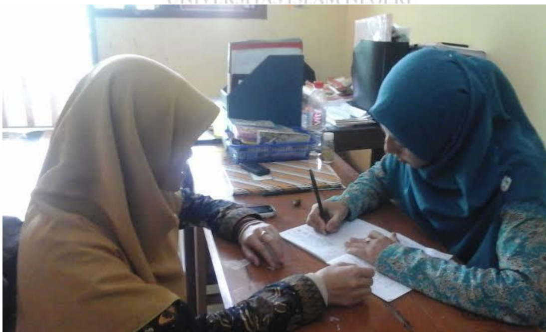
Wawancara dengan Ibu RN guru kelas V A