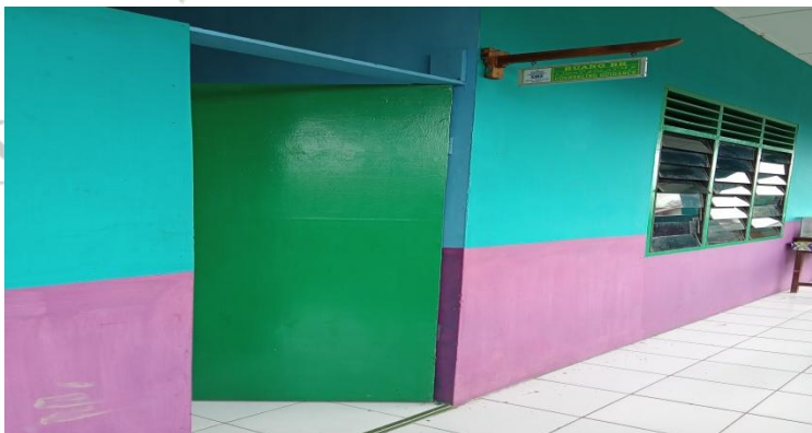
Gambar 11: Ruang BK