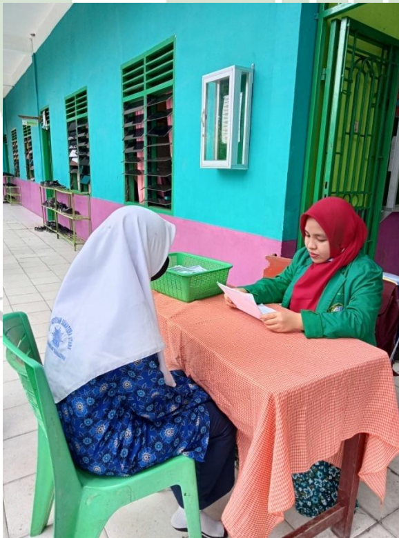
Gambar 6: Melakukan wawancara dengan siswa kelas 8