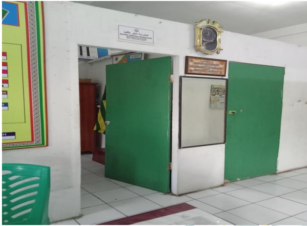
Gambar 14: Ruang Kepala Sekolah