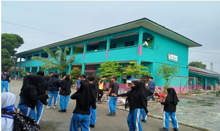
Gambar 9: Gedung Madrasah tampak dari depan