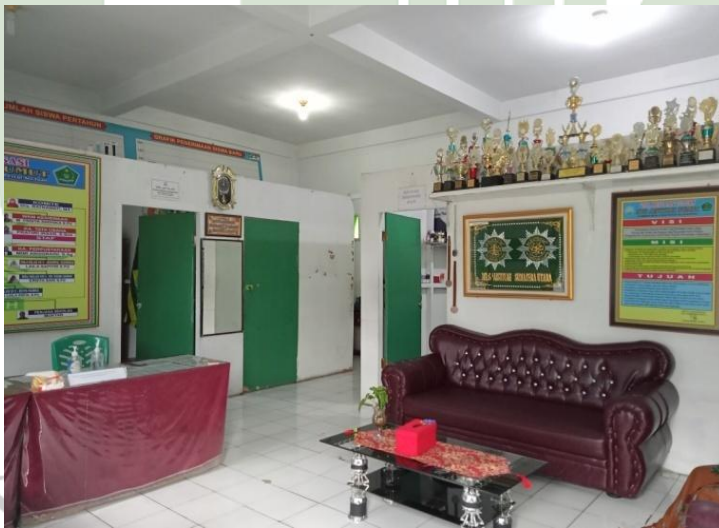
Gambar 13: Kantor Sekolah