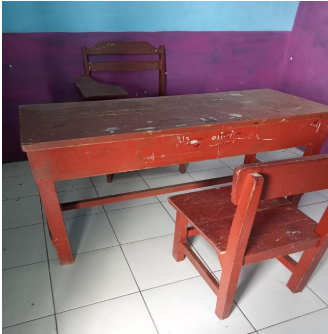
Gambar 12: Ruang Konseling