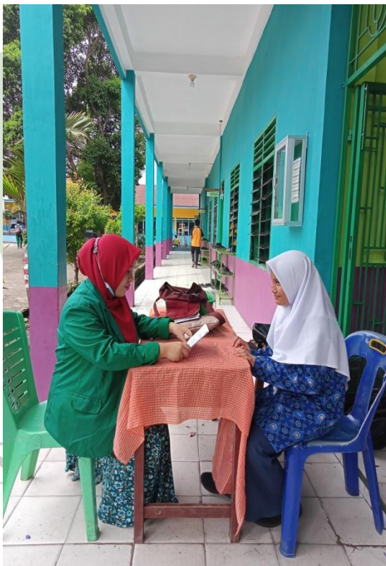
Gambar 8: Melakukan wawancara dengan salah satu siswa kelas 8