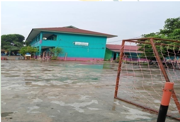
Gambar 10: Gedung madrasah tampak dari samping