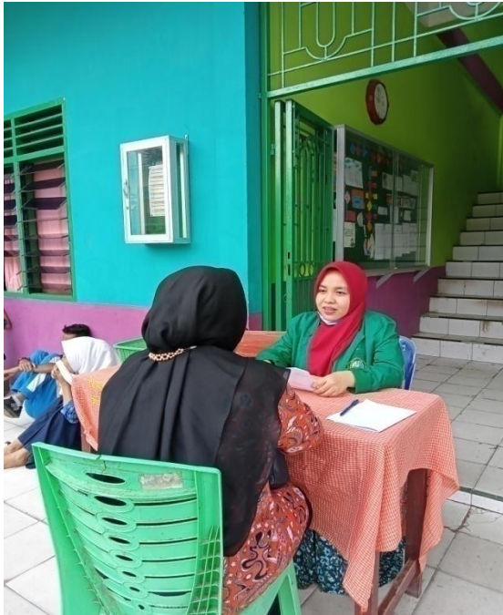
Gambar 3: Melakukan wawancara dengan wali kelas 8