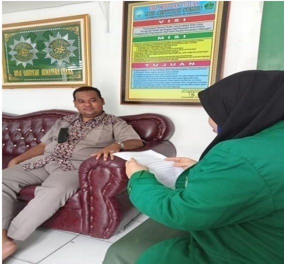
Gambar 1: Melakukan wawancara dengan Guru BK