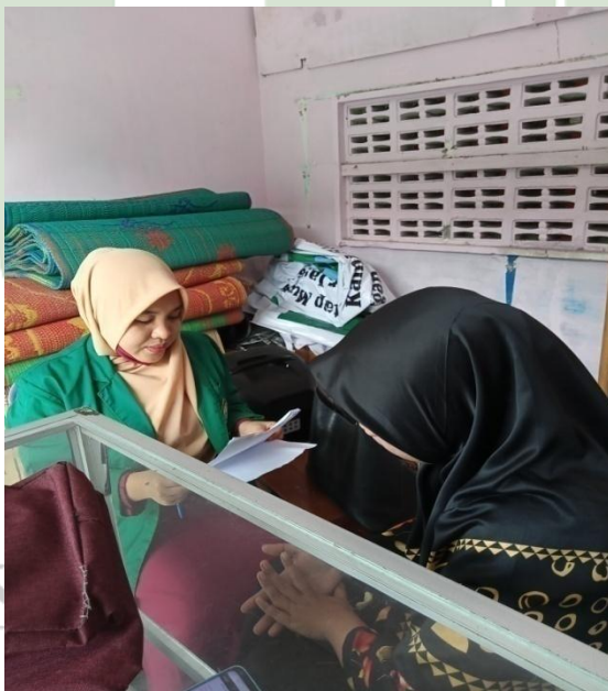
Gambar 4: Wawancara dengan wali kelas 8