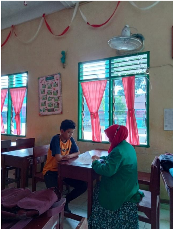
Gambar 5: Melakukan wawancara dengan siswa kelas 8