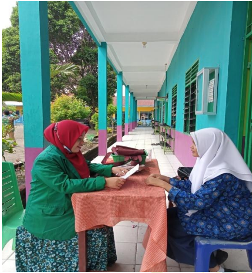
Gambar 7: Melakukan wawancara dengan salah satu siswa kelas 8