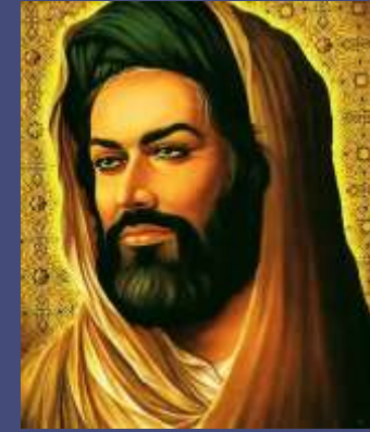
Ali bin Abi Thalib Pemuda dan Rajin Belajar