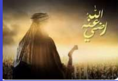
Umar bin Khattab Berani menegakkan Kebenaran