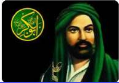
Abu Bakar Ash Siddiq Dewasa, dan bijaksana