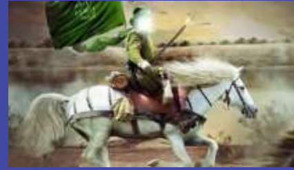
Utsman bin Affan Kaya juga Dermawan