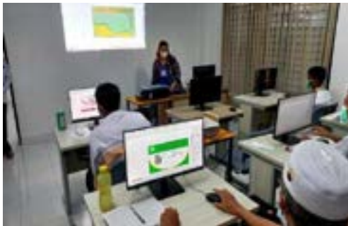
Kegiatan pelatihan kerja di BLK Komunitas Ponpes Saifullah