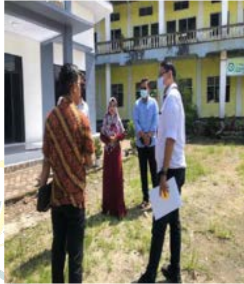
Silaturahmi Tim BBPLK Medan di BLK Komunitas Ponpes Saifullah