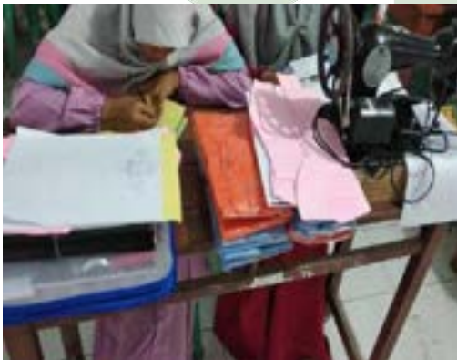
Kegiatan Pelatihan di BLK Komunitas Ponpes Saifullah