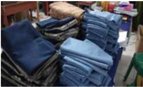
Materi praktek kegiatan pelatihan di BLK Komunitas Ponpes Saifullah