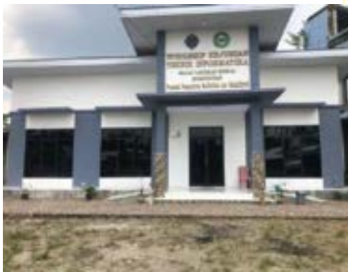
Gedung pelatihan kerja BLK Komunitas Ponpes Saifullah tahun 2020 – sekarang