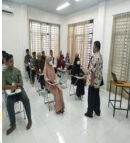
Kegiatan pelatihan di BLK Komunitas Ponpes Saifullah