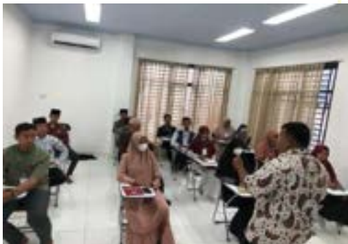
Kegiatan Pelatihan di BLK Komunitas Ponpes Saifullah