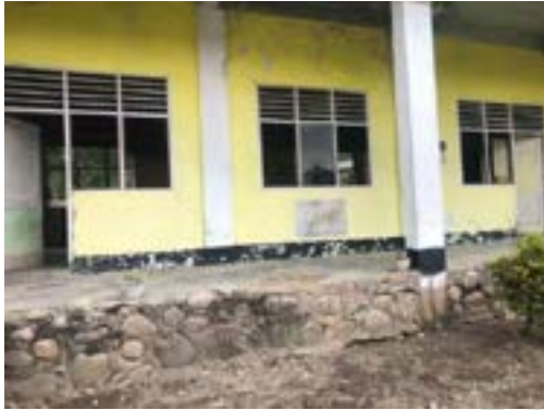
Gedung pelatihan kerja BLK Komunitas Ponpes Saifullah tahun 2019