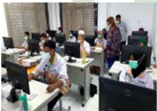
Kegiatan Pelatihan di BLK Komunitas Ponpes Saifullah