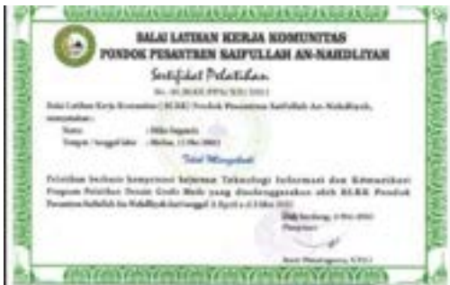
Sertifikat pelatihan kerja BLK Komunitas Ponpes Saifullah