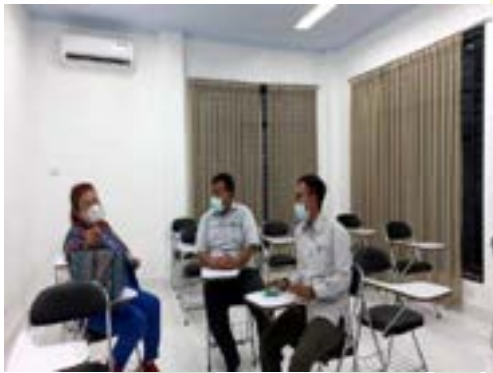
Koordinasi pihak BBPLK Medan bersama Instruktur BLK Komunitas Ponpes Saifullah