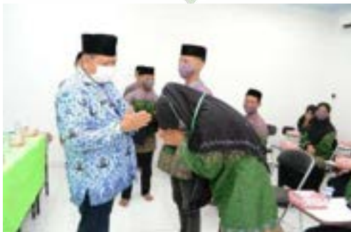
Kegiatan pemberian Card Holder peserta pelatihan di BLK Komunitas Ponpes Saifullah