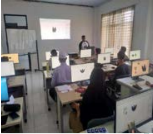
Kegiatan pelatihan di BLK Komunitas Ponpes Saifullah