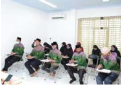
Kegiatan Pemberian Materi Soft Skill di BLK Komunitas Ponpes Saifullah