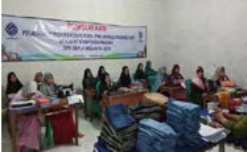
Pembukaan Pelatihan Garmen Apparel BLK Komunitas Ponpes Saifullah