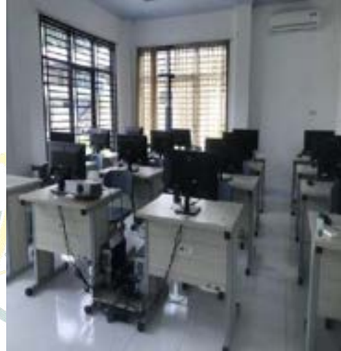
Ruang praktek Pelatihan Kerja di BLK Komunitas Ponpes Saifullah