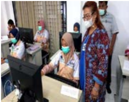
Kegiatan pengawasan oleh pihak BBPLK Medan di BLK Komunitas Ponpes Saifullah