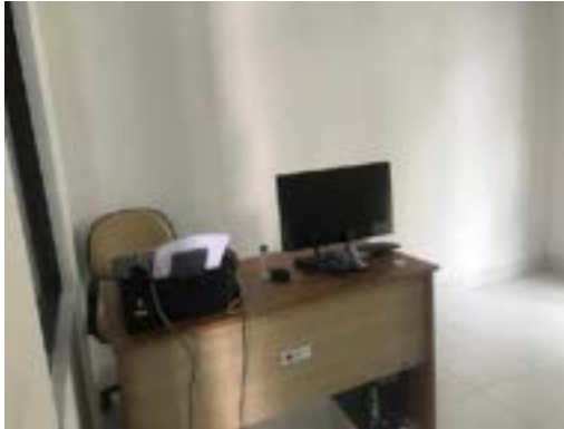
Ruang Administrasi BLK Komunitas Ponpes Saifullah