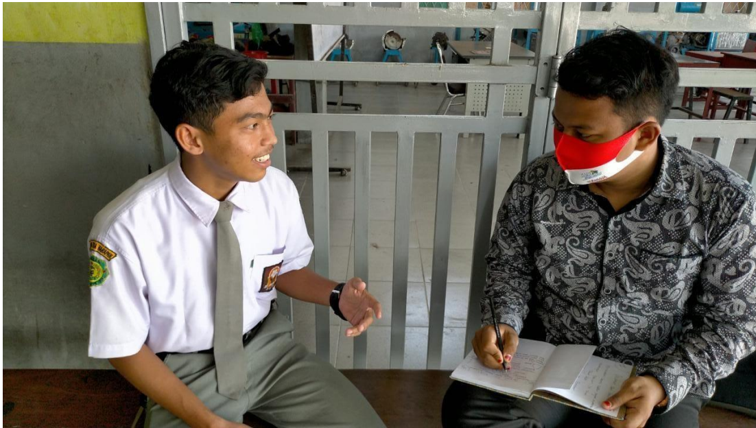
Dokumentasi dengan Kader IPA