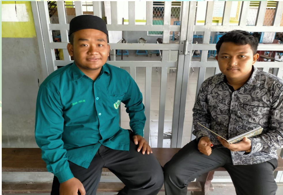
Dokumentasi dengan Pembina Organisasi IPA