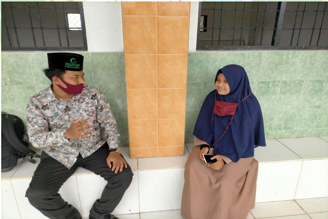
Dokumentasi dengan Siswa yang tidak Mengikuti IPA