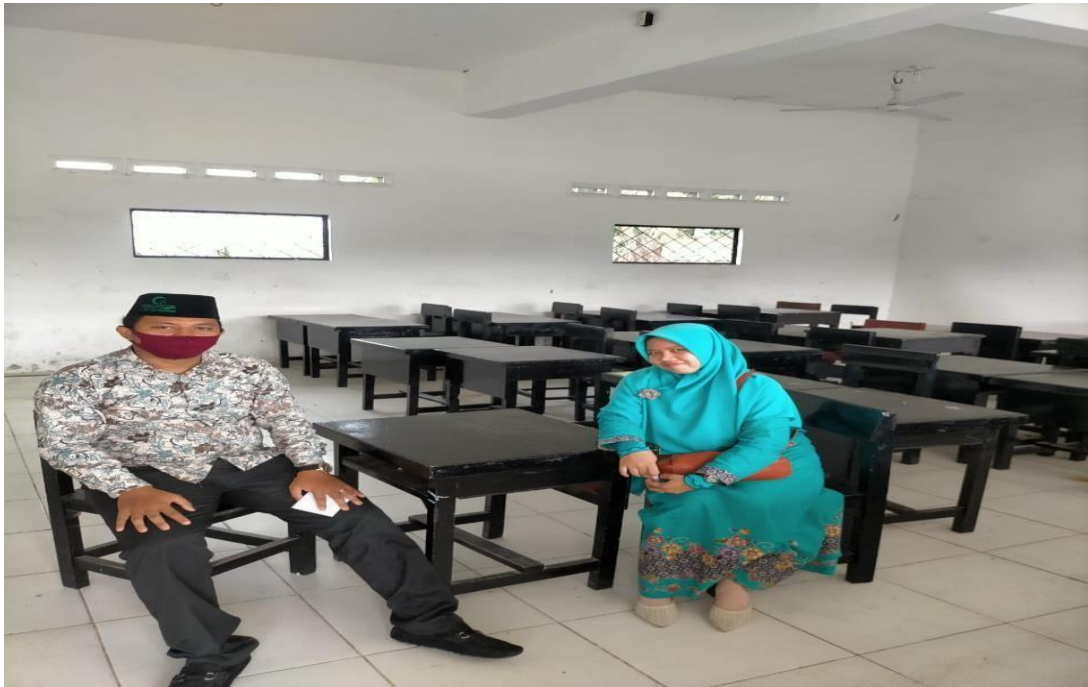
Dokumentasi dengan Guru Agama SMK Citra Harapan