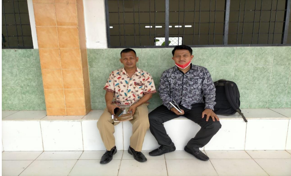
Dokumentasi dengan Wakil Kepala Sekolah Bagian Kesiswaan