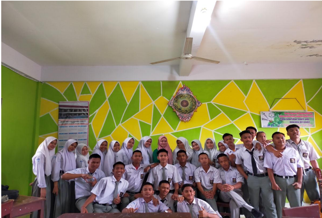
Gambar VI (Tampak Depan Sekolah SMKS Siti Banun)