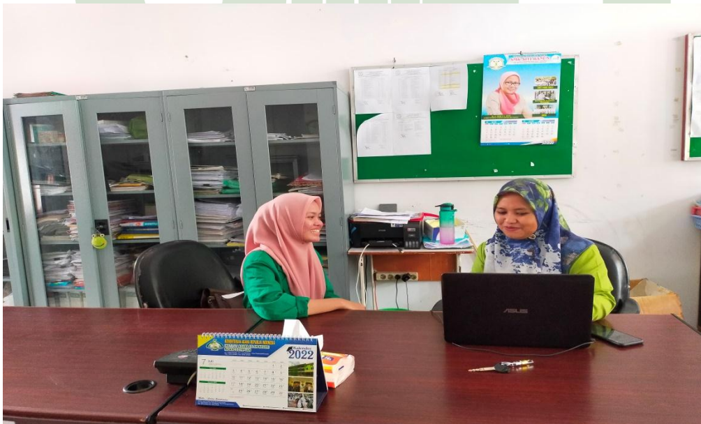
Gambar III (Saat wawancara dengan siswa)