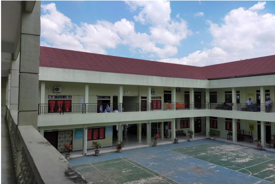
Gambar VIII (Masjid SMKS Siti Banun Sigambal)