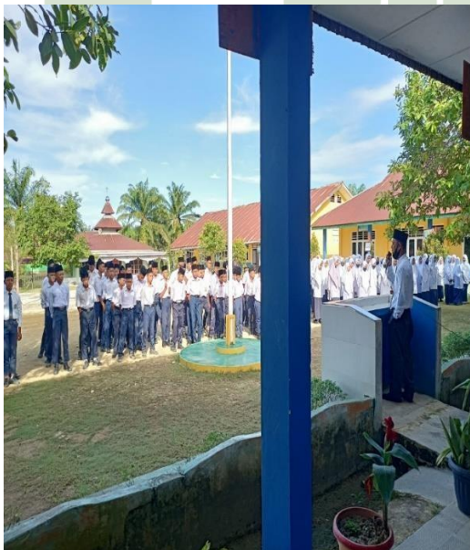
Gambar 15 Guru Memberikan Arahan