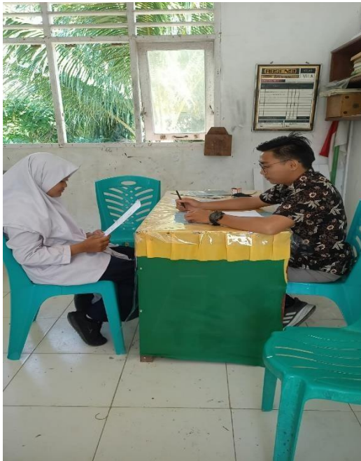
Gambar 13 Wawancara Dengan Siswa