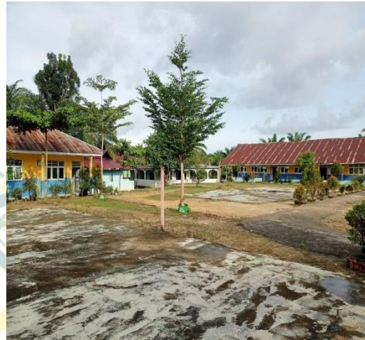
Gambar 2 Lingkungan Sekolah