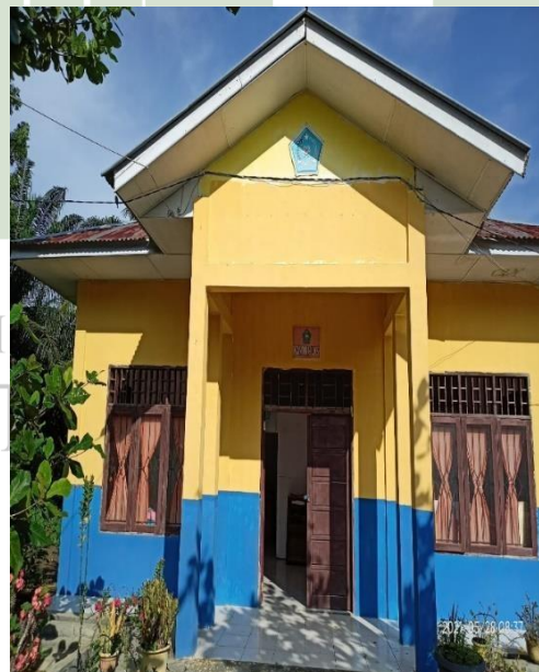
Gambar 16 Kantor UKS