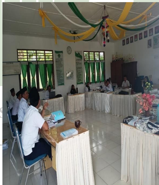
Gambar 4 Rapat Bersama Guru