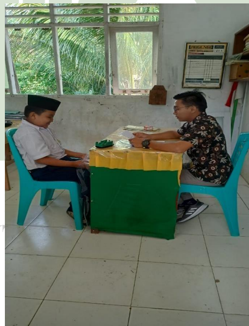
Gambar 12 Wawancara Dengan Siswa