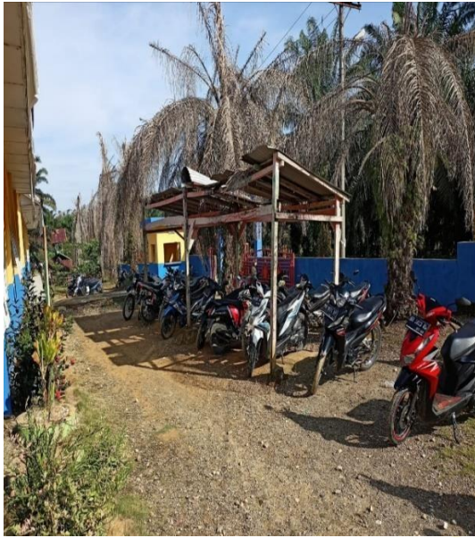
Gambar 21 Parkiran Madrasah