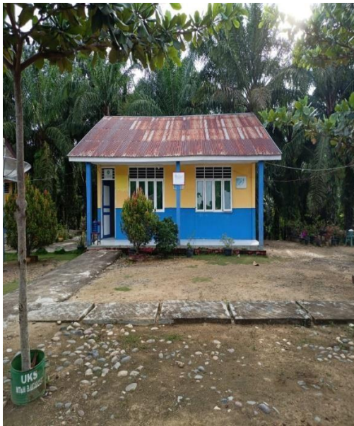
Gambar 5 Depan Ruang Guru