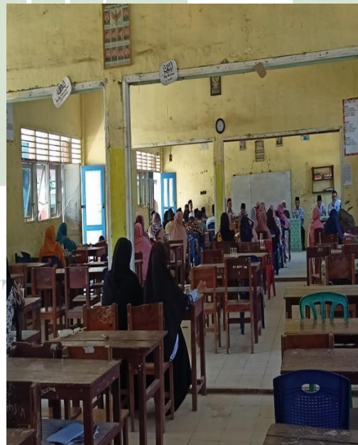
Gambar 8 Rapat Guru Dengan Orang Tua Siswa