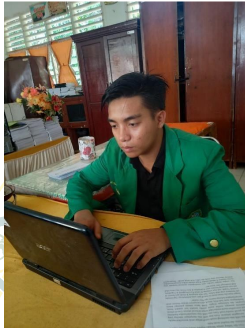
Gambar 14 Peneliti Ikut Serta Membantu Tugas Guru