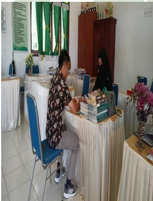
Gambar 11 Wawancara Dengan Guru