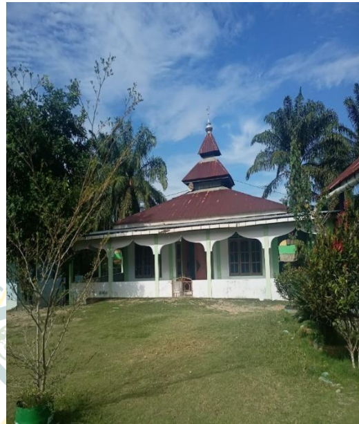
Gambar 6 Musholla