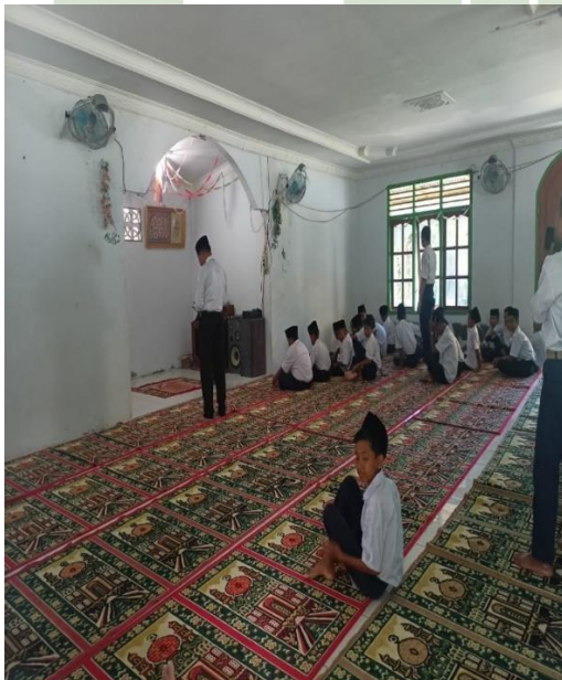
Gambar 7 Sholat Zuhur