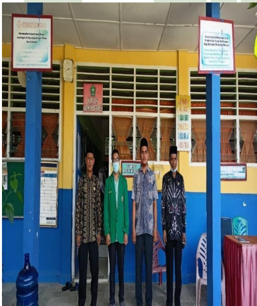
Gambar 23 Foto Bersama Kepsek, Wakasek, Dan Guru Madrasah