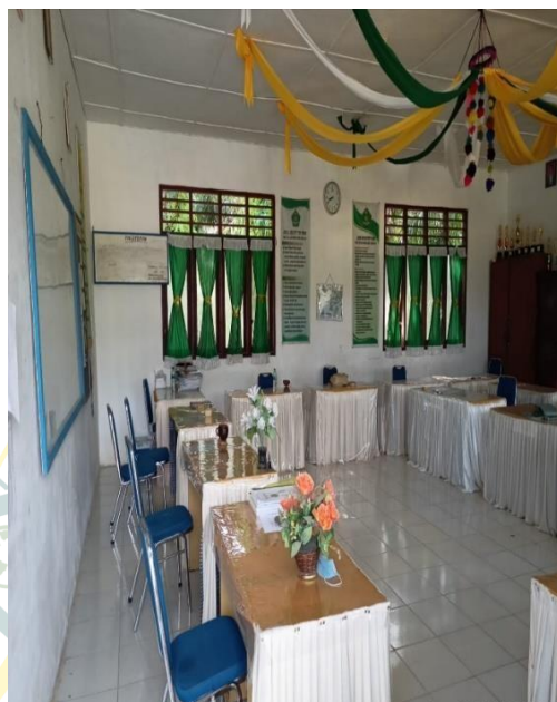
Gambar 18 Ruang Guru