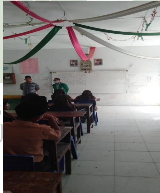
Gambar 24 Observasi Bersama Guru