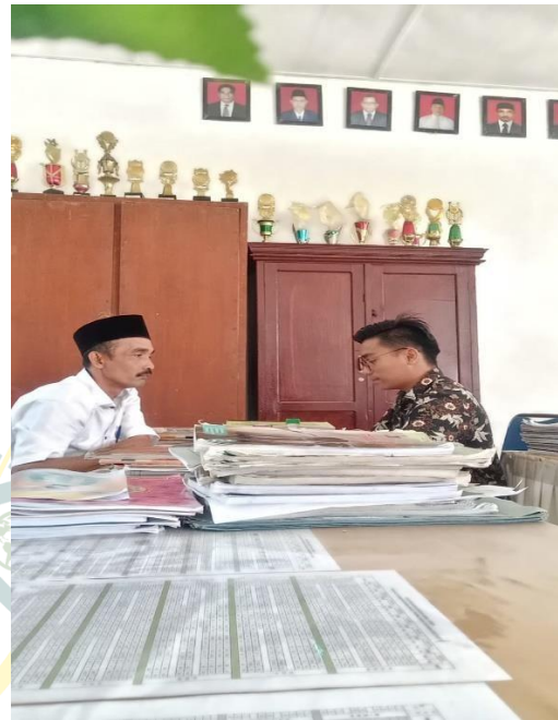
Gambar 10 Wawancara Dengan Guru