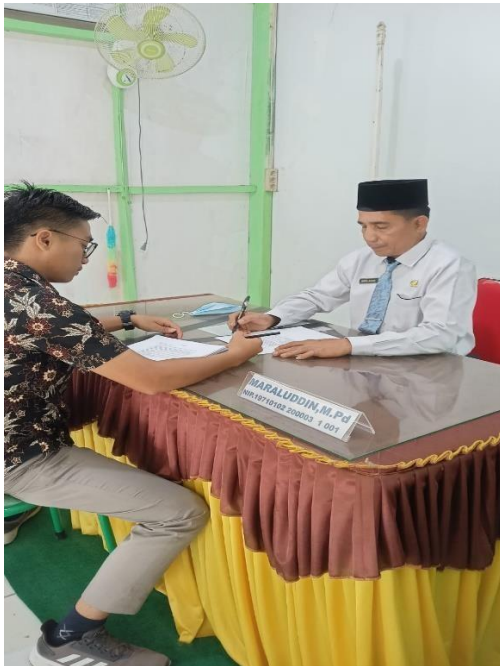
Gambar 9 Wawancara Dengan Kepala Madarrasah