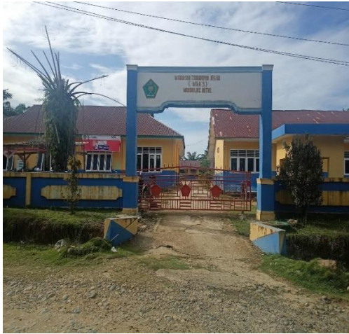
Gambar 1 Depan Madrasah