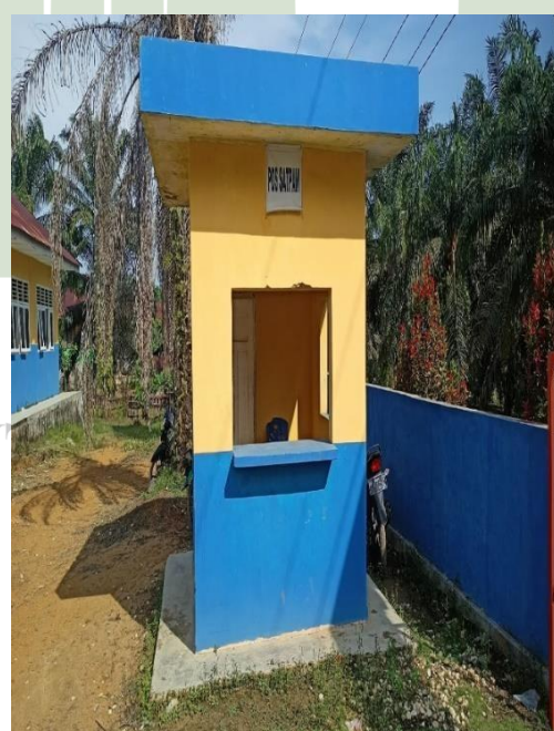
Gambar 20 Pos Satpam