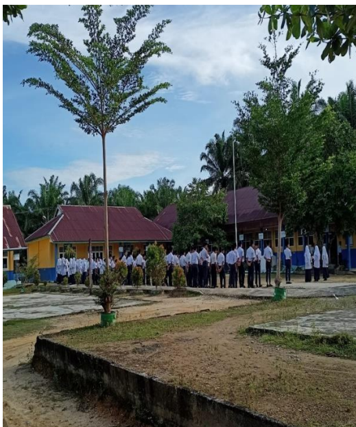
Gambar 17 Kegiatan Upacara