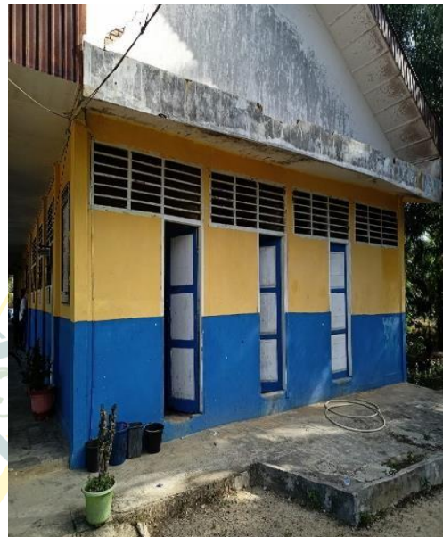
Gambar 22 Kamar Mandi