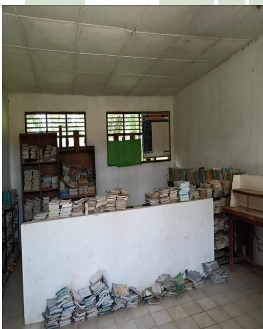
Gambar 19 Perpustakaan