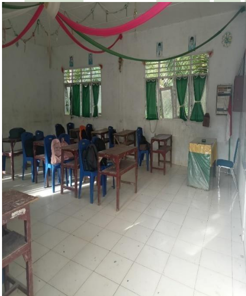
Gambar 3 Ruangan Kelas