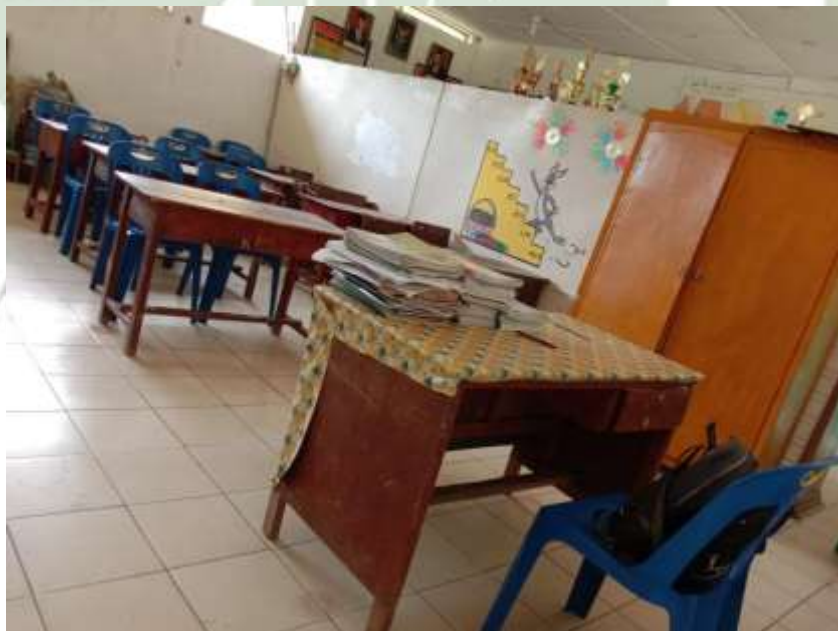
Gambar 14 : Ruang rapat SDN No 108030 Siboras (24 Agustus 2022)