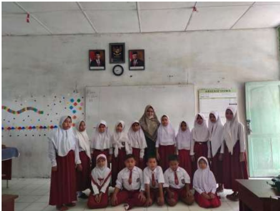
Gambar 15 : Foto Bersama Dengan Murid Kelas V (24 Agustus 2022)