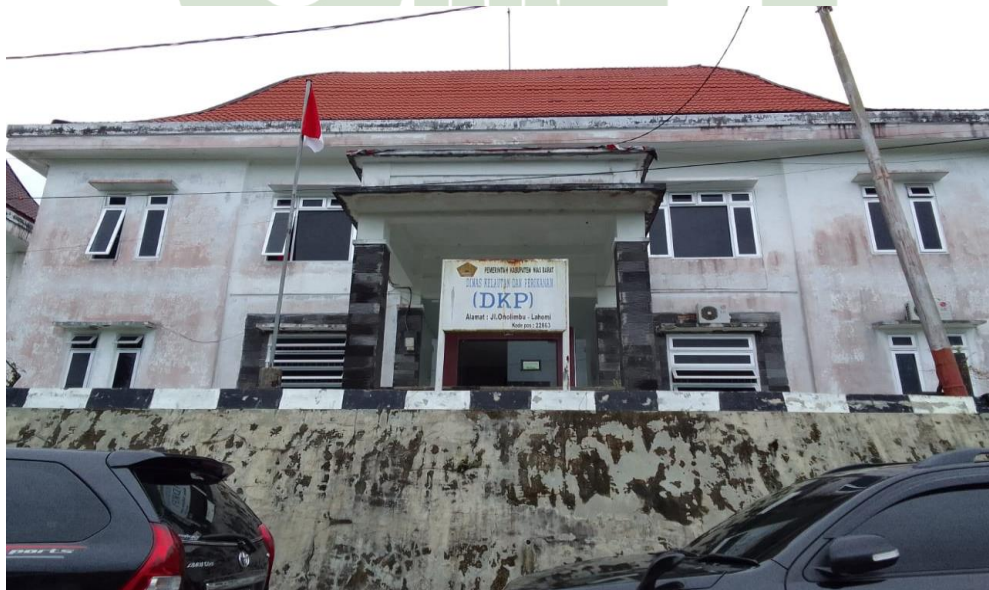
KANTOR DINAS KELAUTAN DAN PERIKANAN KABUPATEN NIAS BARAT