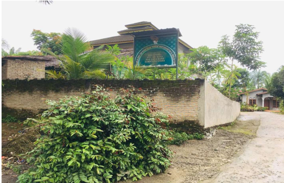
Gambar Majelis Zikir Syekh Sofyan Simbolon Tampak Depan