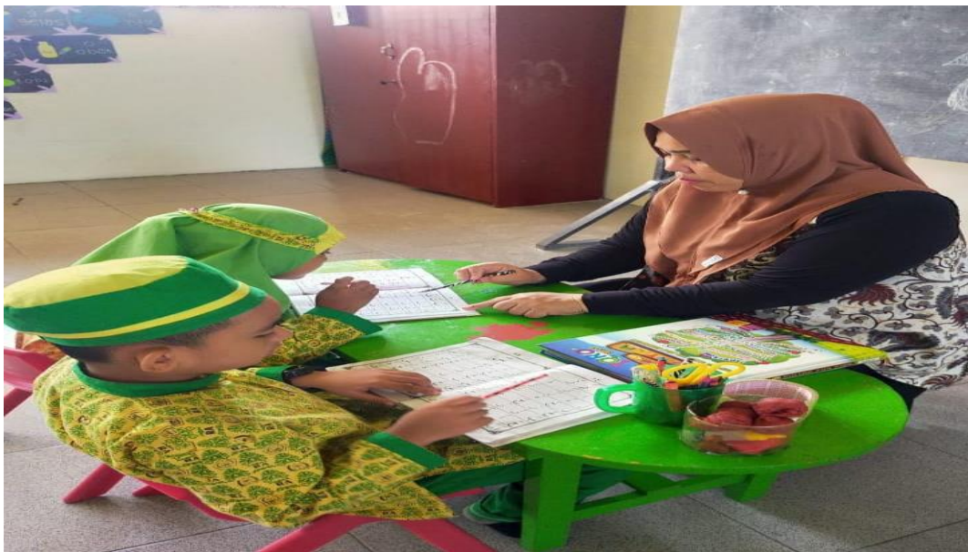
Menyimak Bacaan Iqro' Anak di Kelas Kontrol