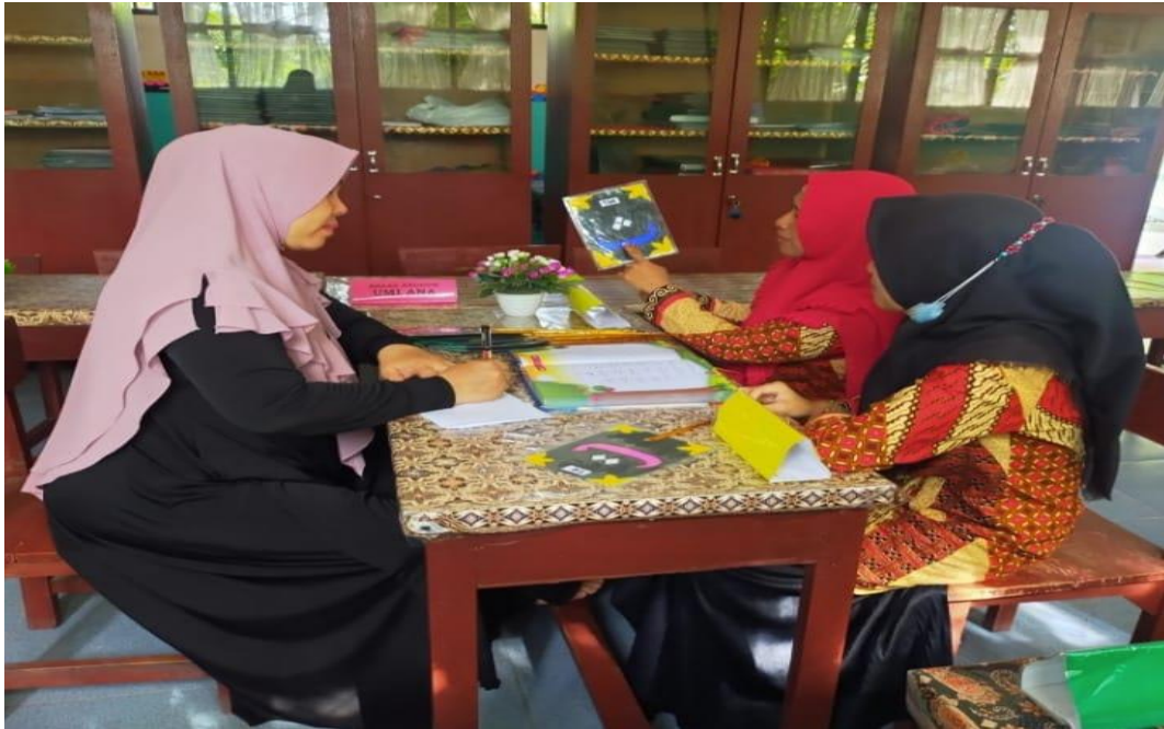
Wawancara dengan Guru RA Ummul Qura