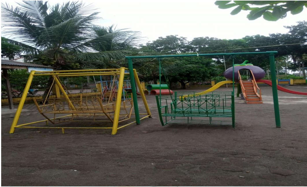
Arena Bermain RA Ummul Qura Stabat