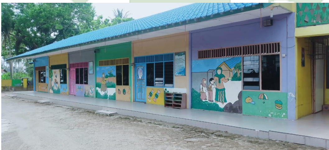
Ruang Kelas RA Ummul Qura Stabat