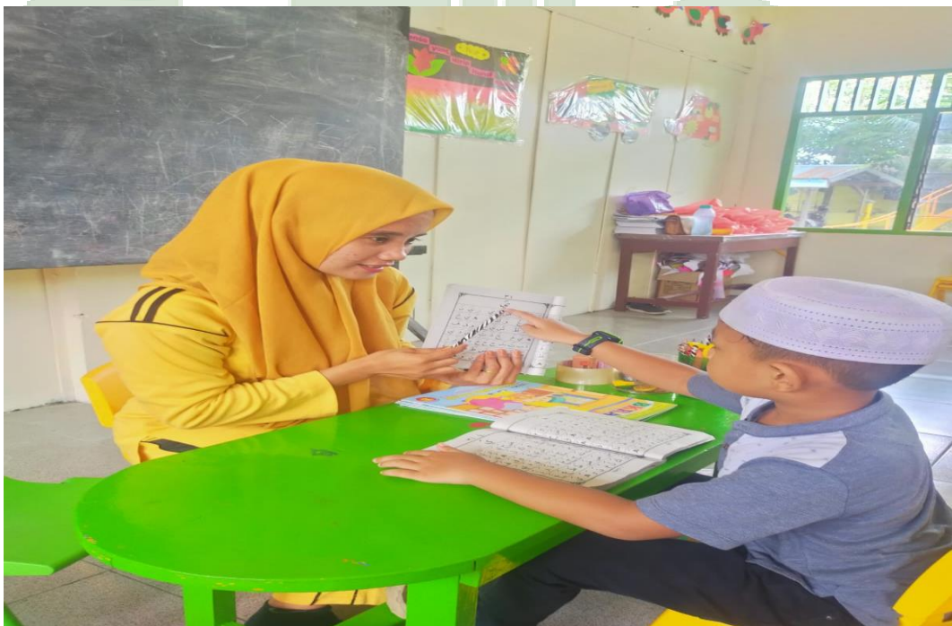
Guru RA Ummul Qura sedang Menyimak Bacaan Iqro' Anak melalui Strategi Terbimbing di Kelas Kontrol