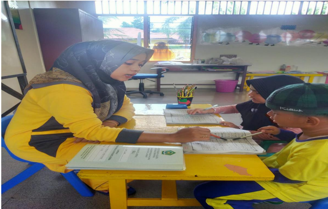
Guru RA Ummul Qura sedang Menyimak Bacaan Iqro' Anak melalui Strategi Terbimbing di Kelas Kontrol