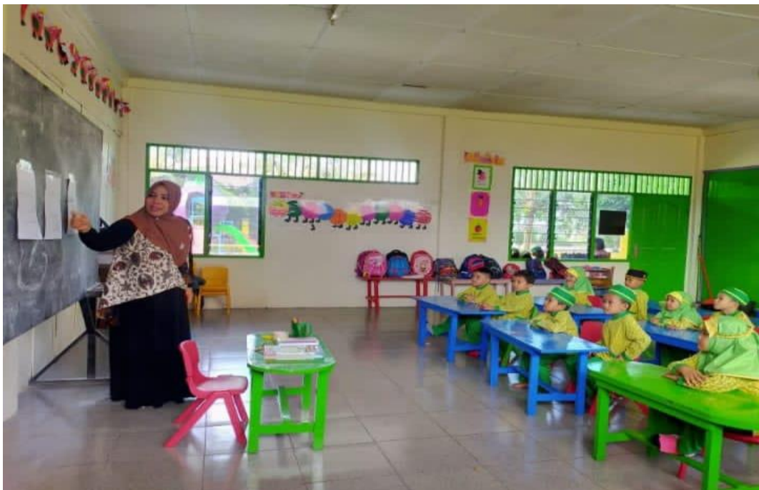
Menerapkan Strategi Pembelajaran Bernyanyi pada Pembelajaran Iqro' di Kelas Eksperimen