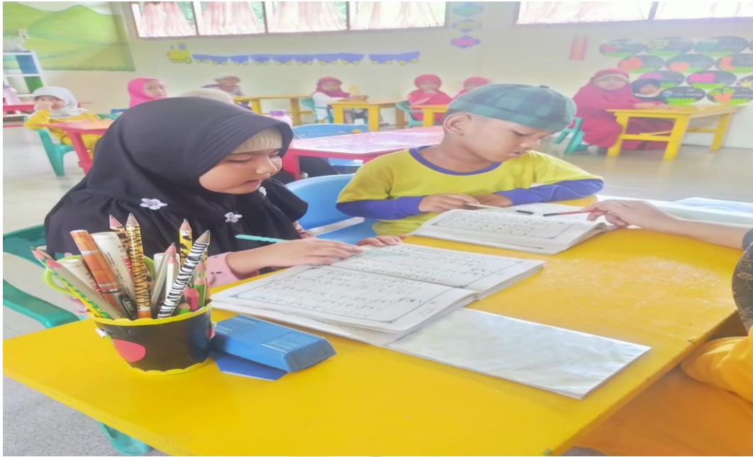
Suasana Kelas Kontrol ketika Pelaksanaan Strategi Terbimbing oleh Guru