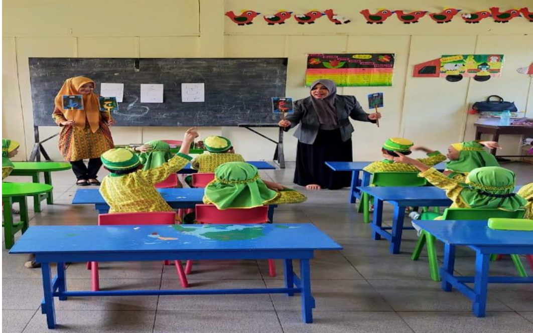
Menerapkan Strategi Pembelajaran Bernyanyi pada Pembelajaran Iqro' di Kelas Eksperimen