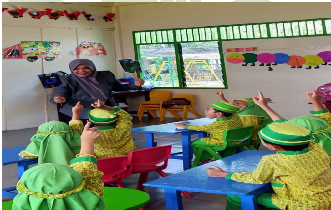
Antusias Anak-anak di Kelas Eksperimen ketika Selesai Diterapkan Strategi Pembelajaran Bernyanyi pada Pembelajaran Iqro'