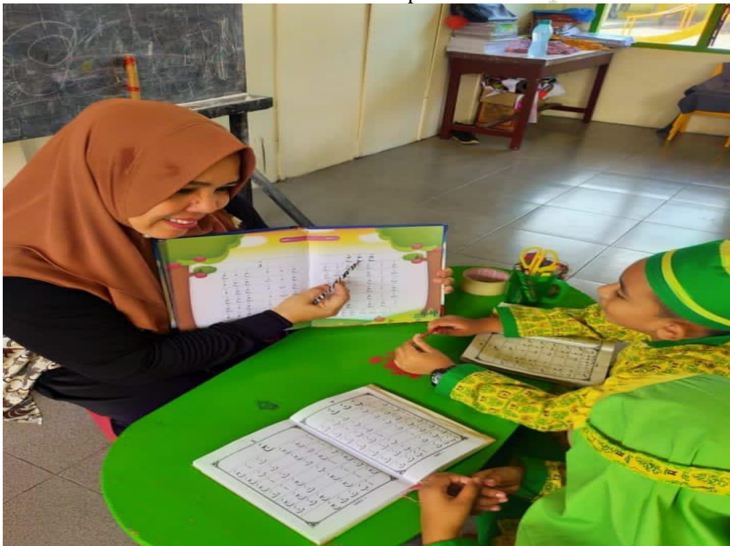
Menyimak Bacaan Iqro' Anak di kelas Eksperimen