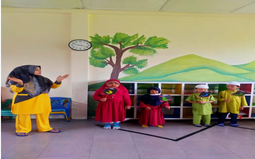
Anak-anak Menyanyikan Lagu yang Sesuai dengan Pembelajaran Iqro' di Kelas Eksperimen