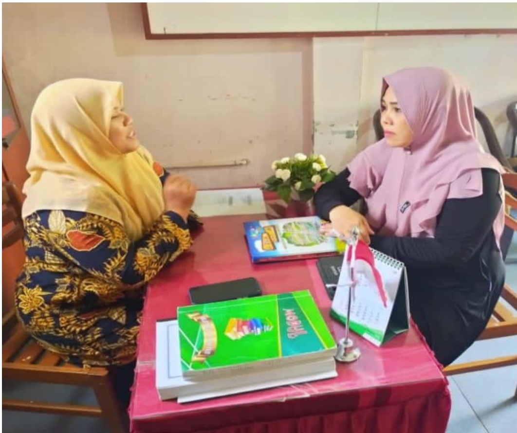
Wawancara dengan Kepala RA Ummul Qura