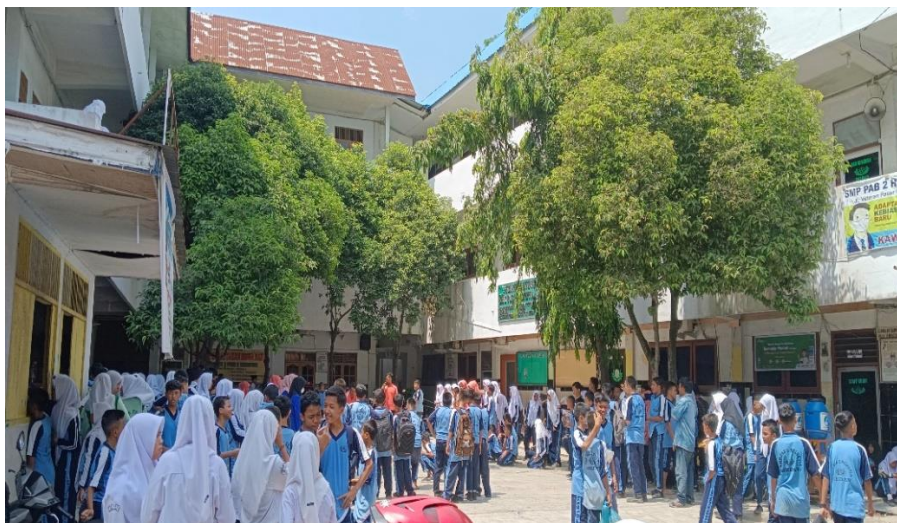
Foto siswa dan siswi MTs PAB 1 Helvetia Jl. Veteran Pasar IV, adapun foto ini menunjukkan para siswa dan siswi persiapan baris/apel mingguan di depan gedung sekolah MTs PAB 1 Helvetia, dan di depan gedung sekolah MTs PAB 1 Helvetia ini terdapat dua pohon, dan foto ini difoto pada pagi hari tepatnya pada hari Jumat 29 Juli 2022 Jam 07.10 WIB.