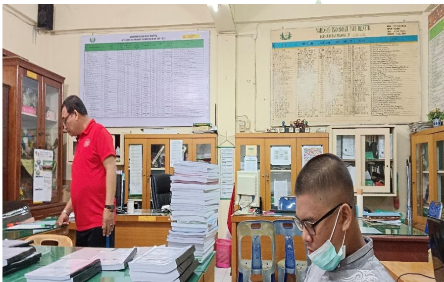
Foto ruangan kantor MTs PAB 1 Helvetia Jl. Veteran Pasar IV, di dalam kantor ini ada dua guru yang pakai kaca mata, satu memakai baju warna merah, dan yang satu lagi memakai baju warna abu-abu dan memakai masker, di dalam kantor ini ada beberapa lemari yang berisikan dokumen-dokumen penting yang berhubungan dengan sekolah, dan di atas meja terdapat buku ajar, laporan guru, dan lain sebagainya, foto ini difoto pada pagi hari tepatnya pada hari Jumat 29 Juli 2022 Jam 09.45 WIB.