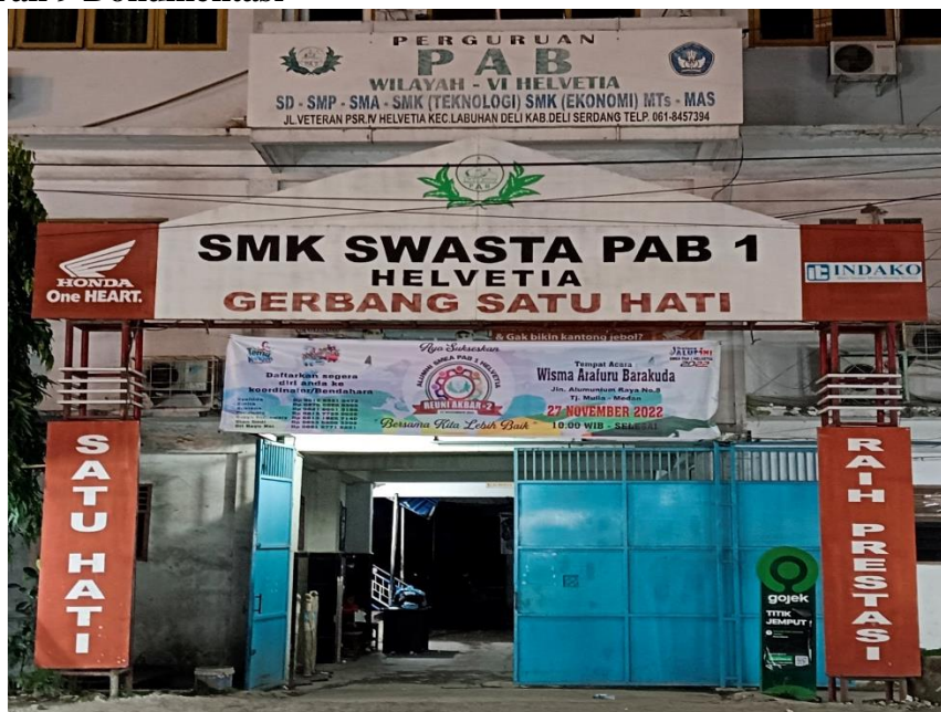
Foto gerbang satu hati MTs PAB 1 Helvetia Jl. Veteran Pasar IV, adapun pintu gerbangnya berwarna biru, dan di atas gerbang ini ada pelang berwarna putih yang bertuliskan (Perguruan PAB Wilayah – VI Helvetia SD – SMP – SMA – SMK (Teknologi) SMK (Ekonomi) MTs – MAS), dan foto ini difoto pada siang hari tepatnya pada hari Rabu 27 Juli 2022 Jam 13.25 WIB.