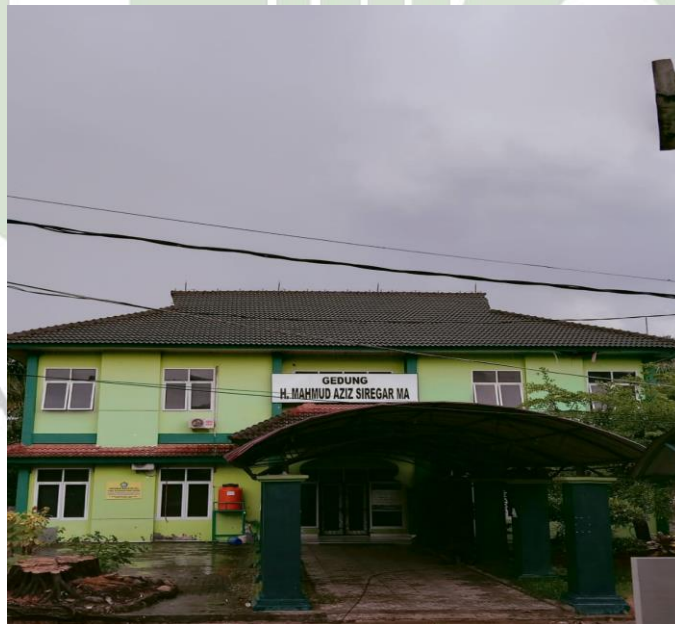
Gedung H. Mahmud Aziz Siregar MA