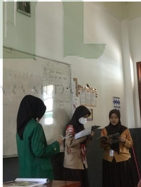
الملحق ١. تعليم في الفصل