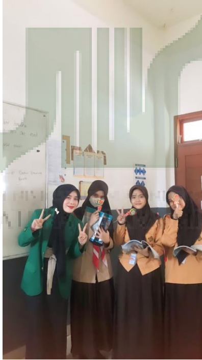
الملحق ٢. تصوير مع الطلاب