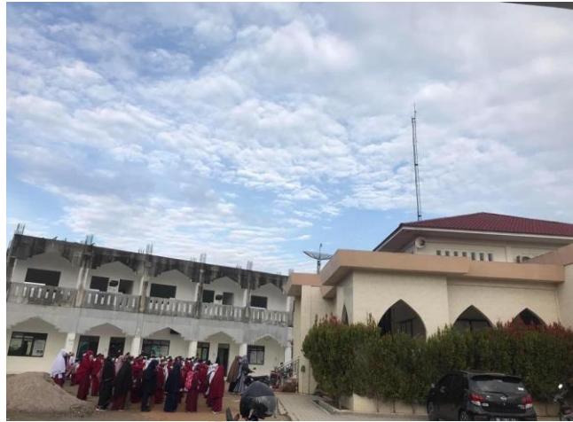
Gambar : Observasi kegiatan yang ada di Yayasan Ihyaus Sunnah