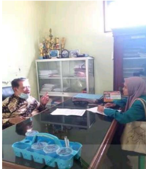
Gambar : Wawancara dengan Kepala Tokoh As-sunnah di Yayasan Ihyaus Sunnah Kec. Rantau Utara