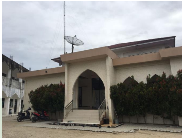
Gambar . Foto Yayasan

Terletak di Jl.Perintis, Padang Bulan, Kec. Rantau Utara, Kab. Labuhan Batu Prov Sumatera Utara.