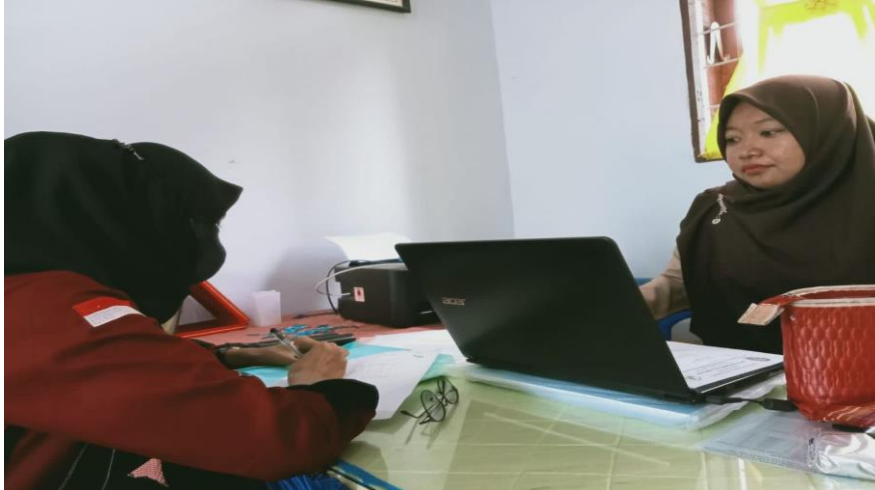
Gambar 5: Wawancara dengan Kabag TU di SD N.105325