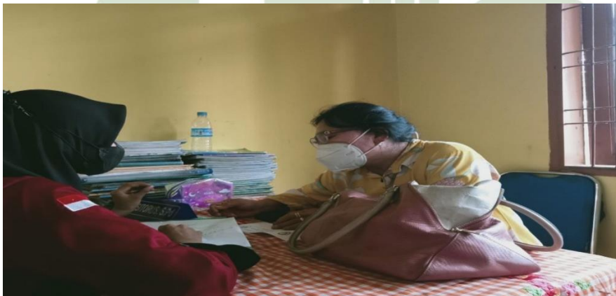
Gambar 3: Wawancara kepada penanggungjawab 1 program UKS di SD N.105325