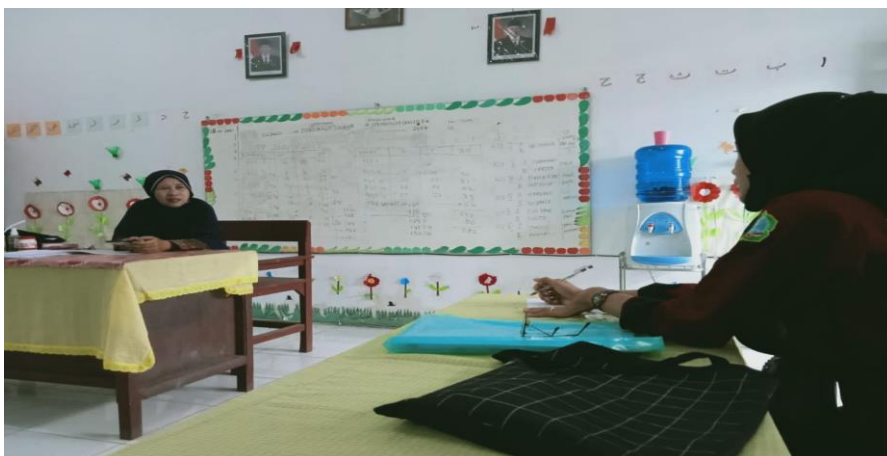
Gambar 4: Wawancara dengan penanggungjawab 2 program UKS di SD N.105325