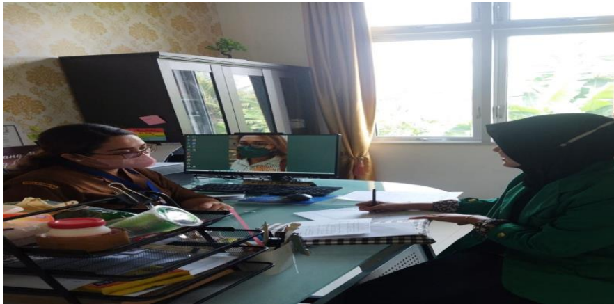
Gambar 2: Wawancara kepada pemegang program UKS di Puskesmas Dalu 10