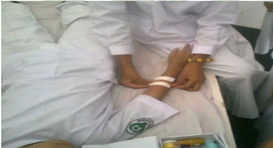
Gambar 6: Praktek kader UKS/dokter kecil