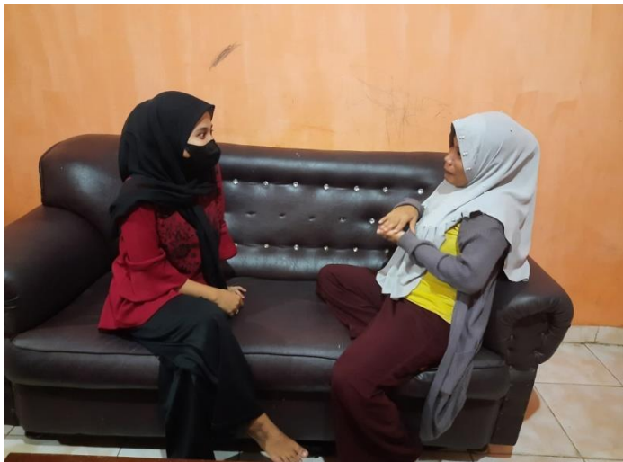
Wawancara dengan Ibu Tini ibu rumah tangga dengan 1 orang anak