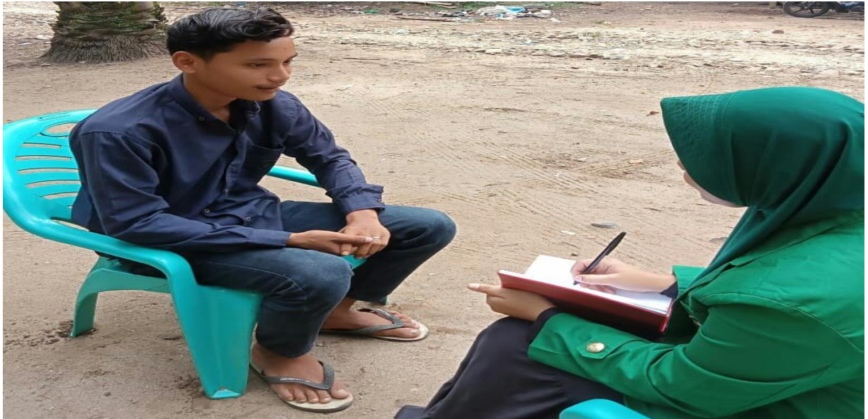
Gambar 7. Wawancara dengan AS Remaja Yang Mengkonsumsi Tuak