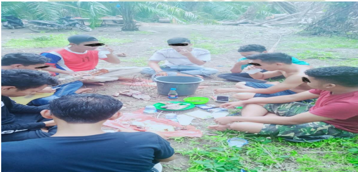
Gambar 4. Tradisi minum tuak dikalangan remaja Desa Siancimun Kecamatan Halongonan Timur dengan melakukan perkumpulan.