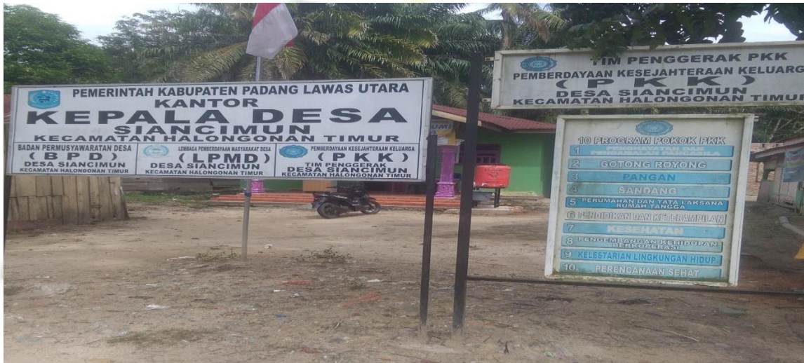
Gambar1. Kantor kepala Desa Siancimun Kecamatan Halongonan Timur Kabupaten Padang Lawas Utara