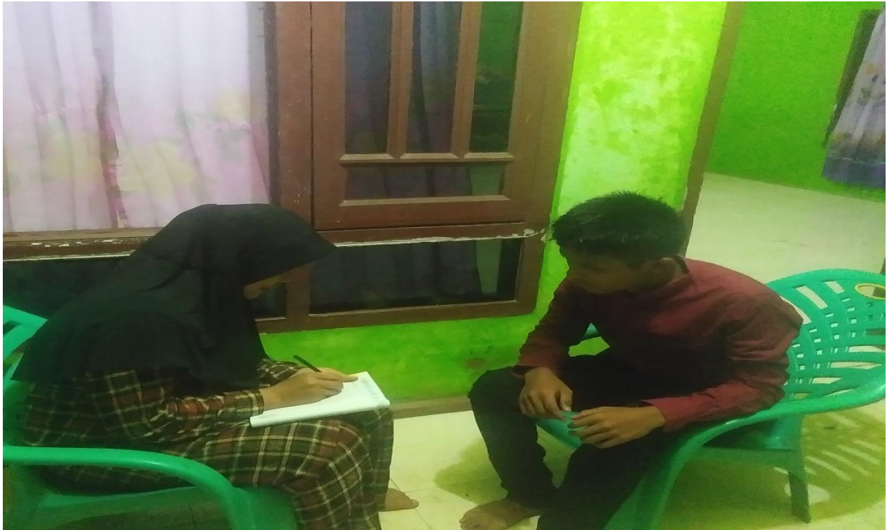
Gambar 5. Wawancara dengan HN Remaja Yang mengkonsumsi Tuak