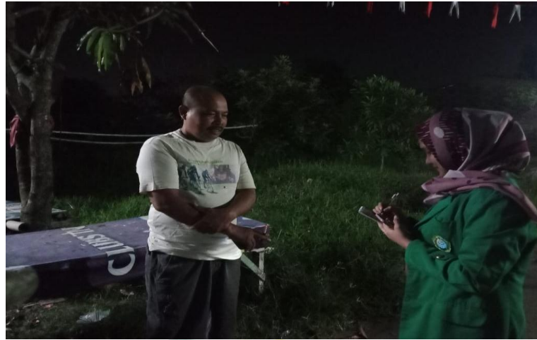
Wawancara dengan masyarakat Pematang Johar