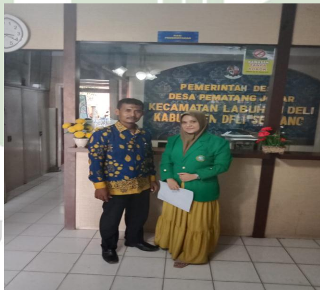
Wawancara dengan Perangkat Desa