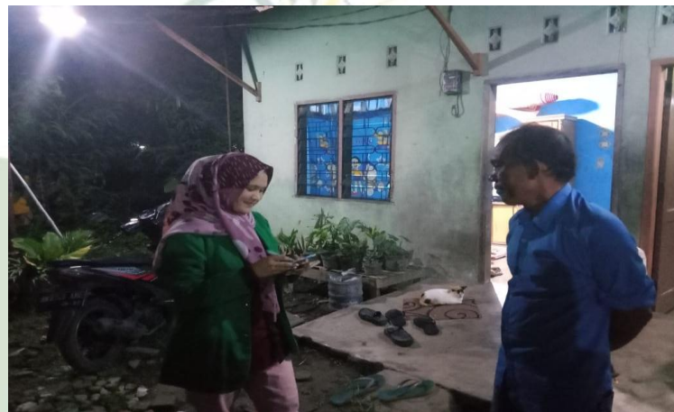
Wawancara dengan masyarakat Pematang Johar