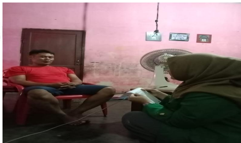
Wawancara dengan masyarakat Pematang Johar