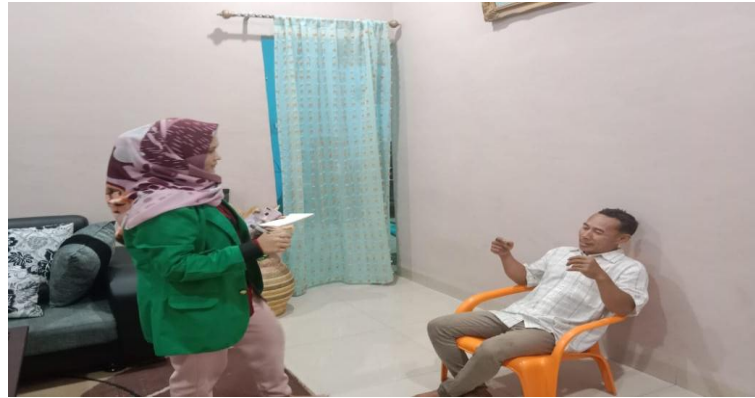
Wawancara dengan Tokoh Adat/ tokoh spritual