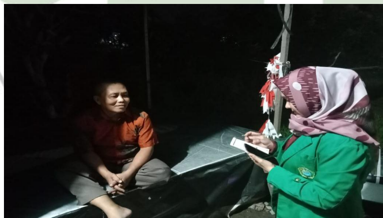
Wawancara dengan tokoh Agama /masyarakat Pematang Johar