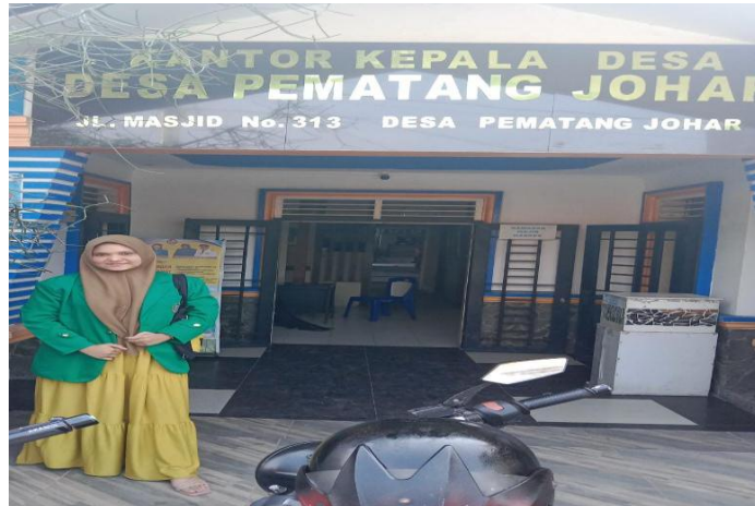
Kantor kepala Desa Pematang Johar