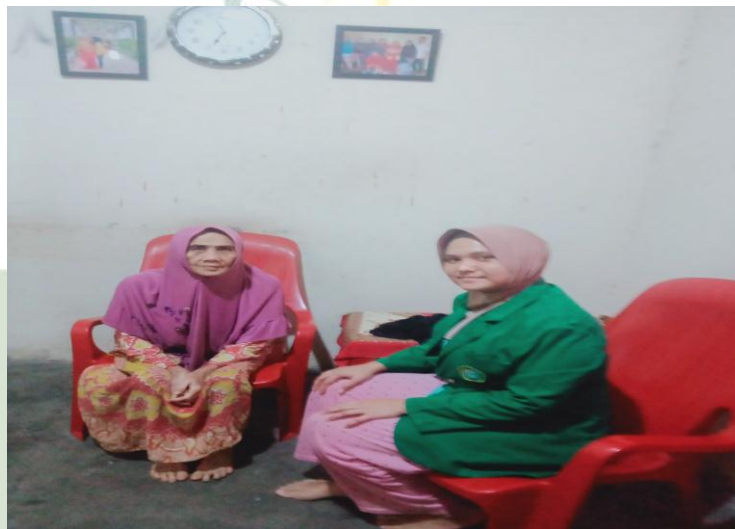
Salah Satu Contoh Paham Animisme di Pematang Johar