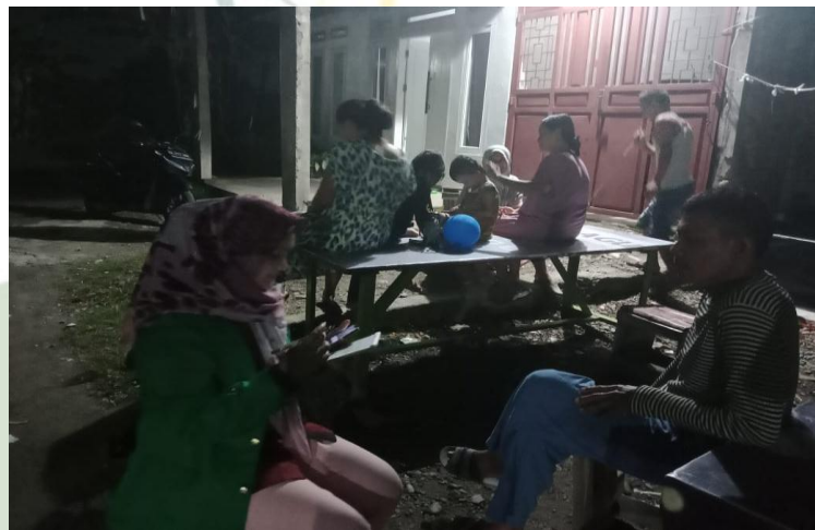
Wawancara dengan masyarakat Pematang Johar