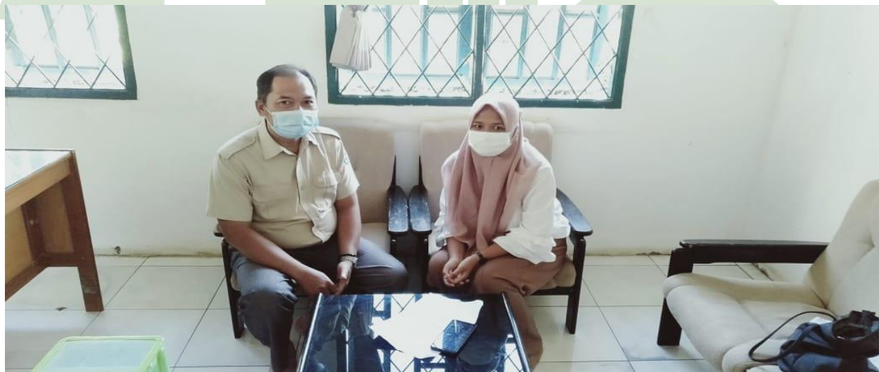
Wawancara dengan Bapak KTU (Kepala Tata Usaha) PT. Gruti Lestari Pratama Kec, Sinunukan