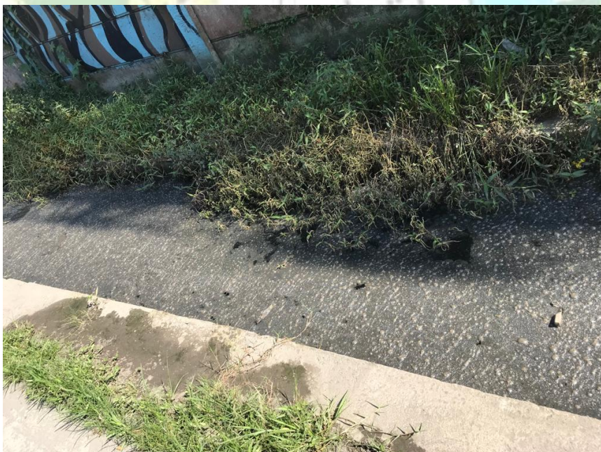
Pencemaran lingkungan yang terjadi di sekitar rumah warga