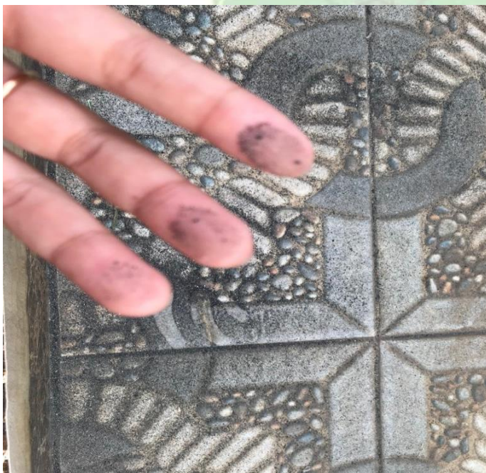
Pencemaran lingkungan yang terjadi di sekitar rumah warga