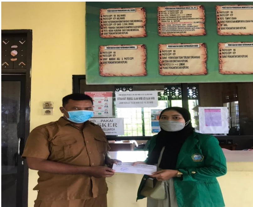
Wawancara yang dengan bapak lurah mabar hilir