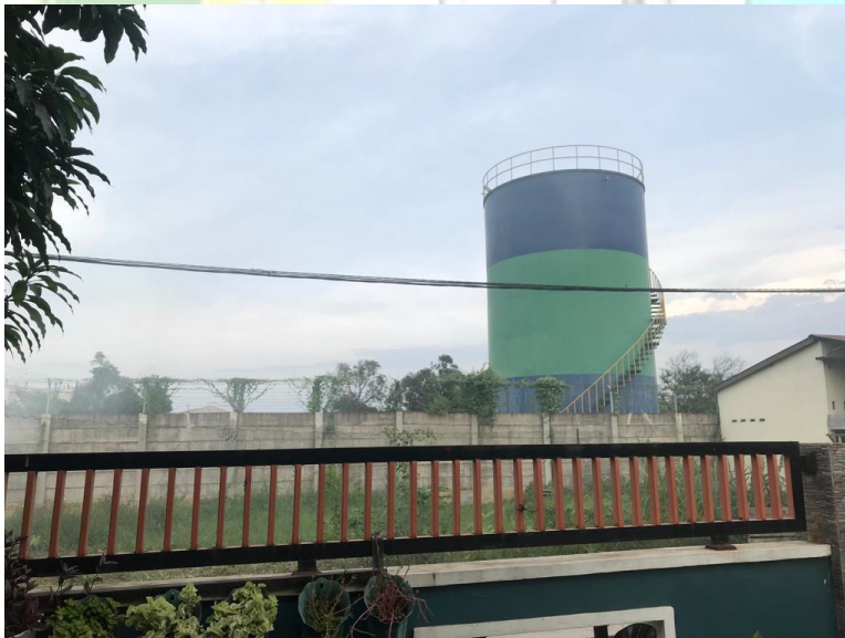
Pencemaran lingkungan yang terjadi di sekitar rumah warga