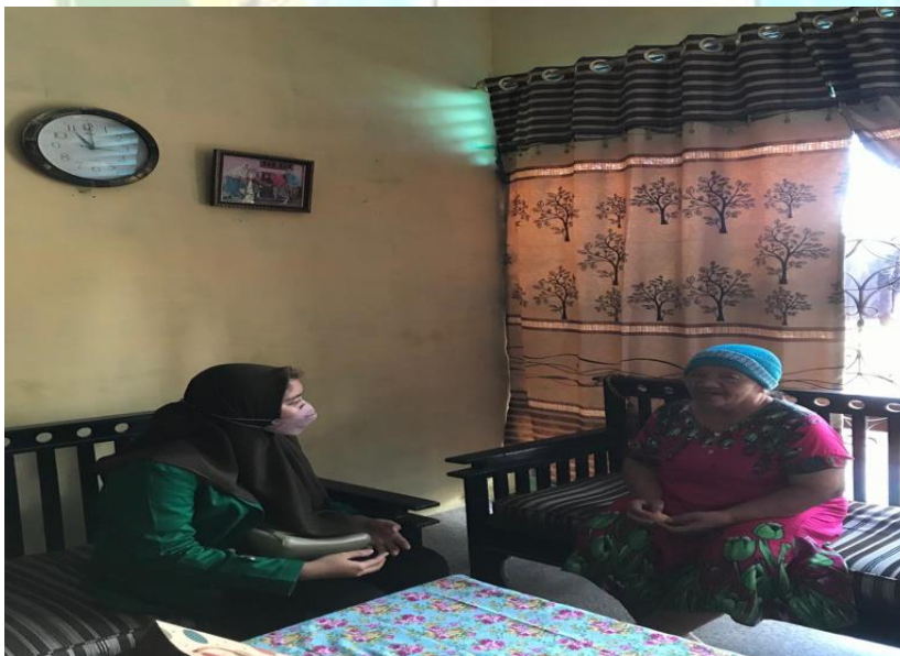
Wawancara dengan Ibu Ngademi selaku masyarakat