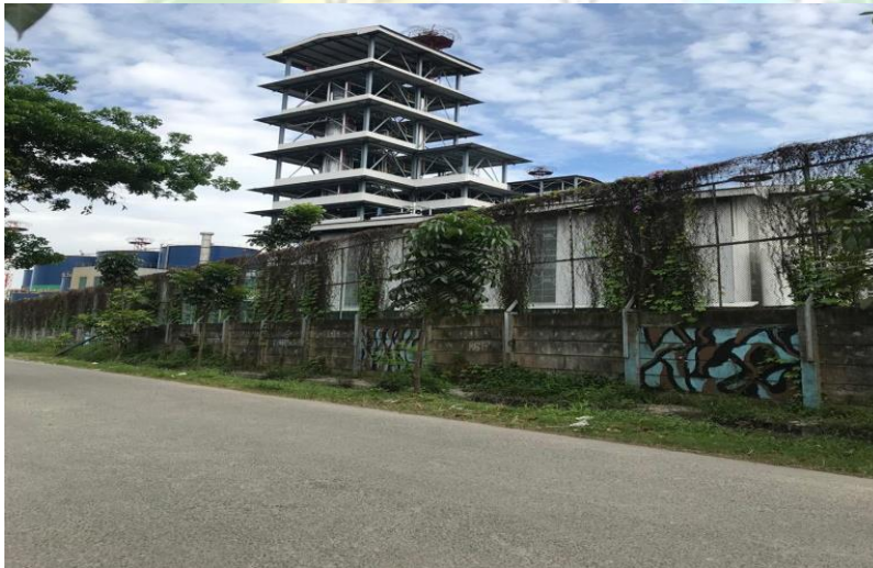
Lokasi pabrik yang berdekatan dengan rumah warga