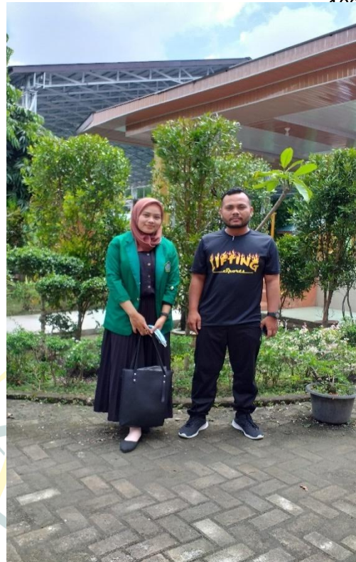
Foto Wawancara dan Foto bersama Guru BK MAN 2 Deli Serdang