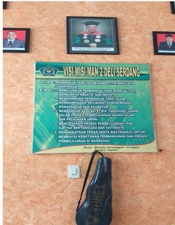
Visi dan Misi MAN 2 Deli Serdang