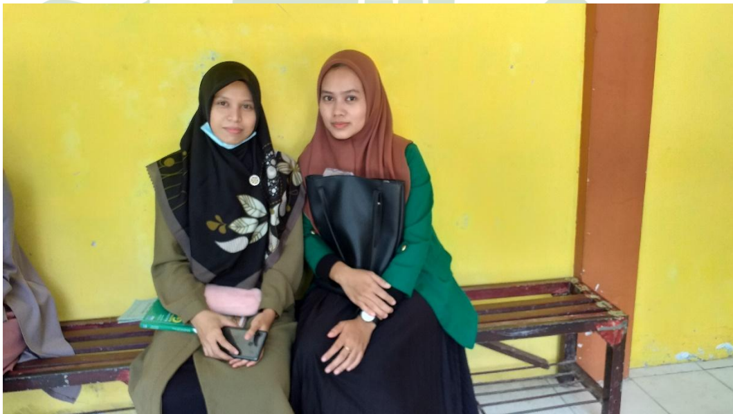
Foto Bersama Wali Kelas X-MIA5 MAN 2 Deli Serdang