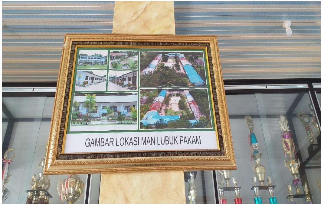
Denah Lokasi MAN 2 Deli Serdang