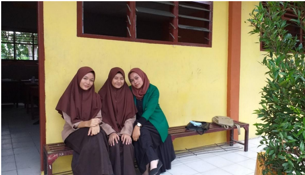
Foto Bersama Siswa MAN 2 Deli Serdang