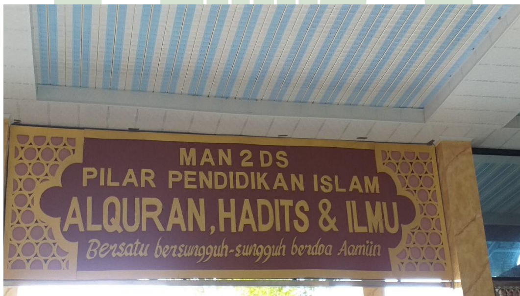
Semboyan MAN 2 Deli Serdang