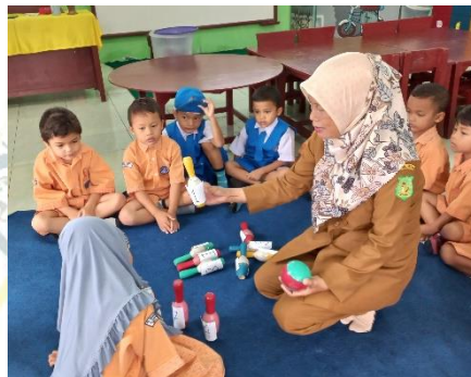
( Kegiatan Menyebutkan Bilangan dengan Benda )