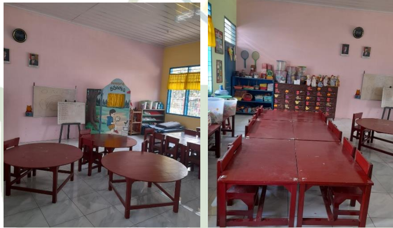
( Ruang Belajar TK Negeri 2 Pembina Medan )