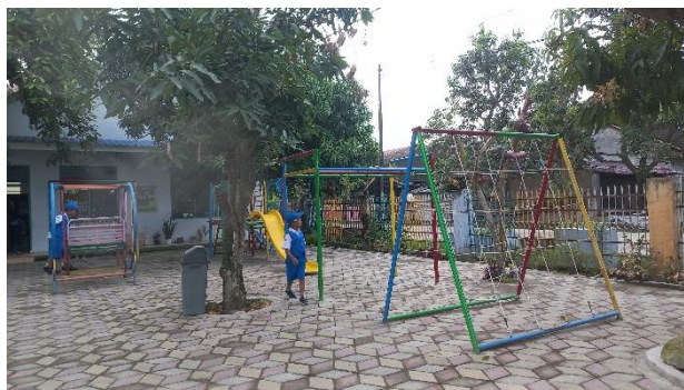
( Permainan diluar kelas )