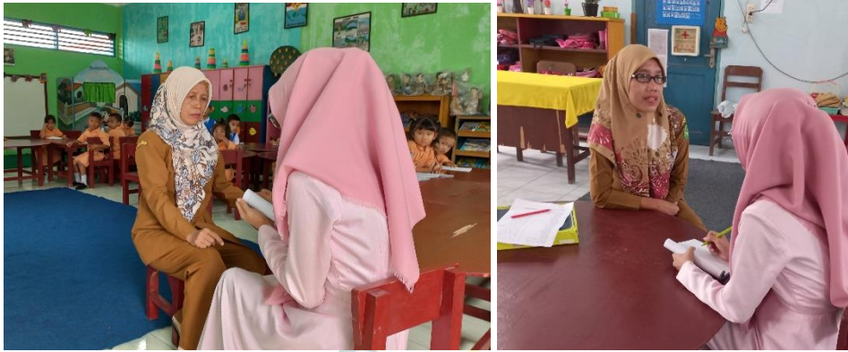
( Wawancara Bersama Guru )