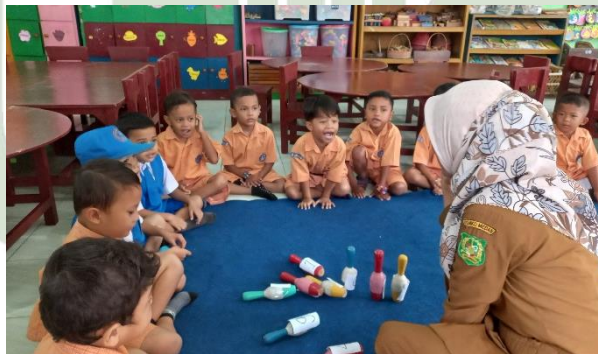
( Kegiatan Menunjuk Bilangan Dengan benda )