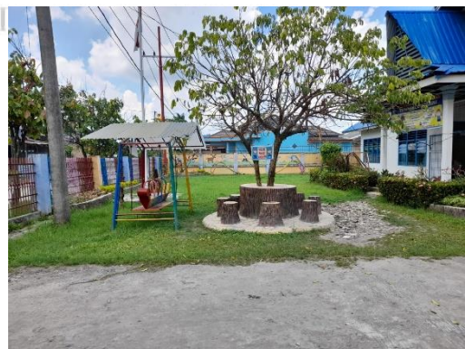
( Bagian Depan Sekolah TK Negeri 2 Pembina Medan )