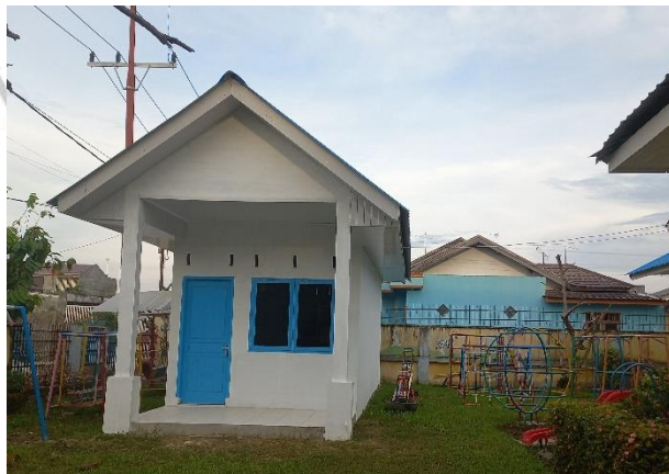
( Ruang UKS TK Negeri 2 Pembina Medan )