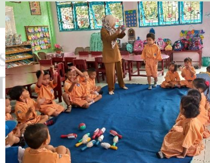
( Kegiatan Menggelindingkan Pin Bowling )