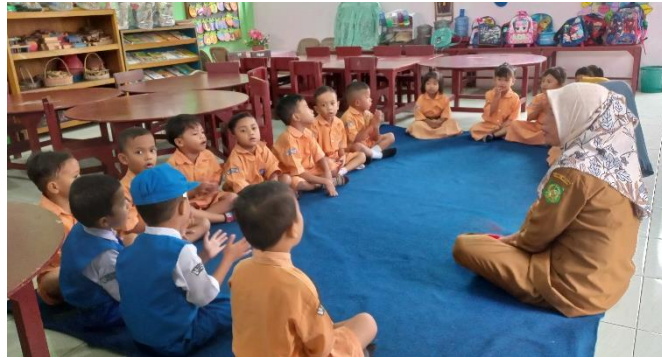
( Pembukaan pembelajaran )