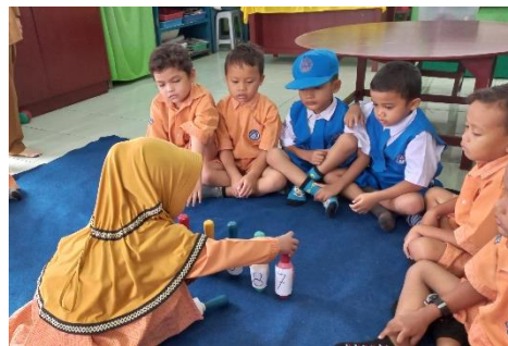
( Kegiatan Mengurutkan Bilangan Dengan Benda )