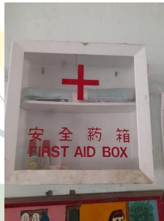
( Permainan didalam kelas dan kotak P3K )