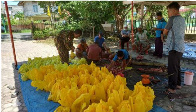
Foto kegiatan Qurban yang diadakan DPD Partai Golkar Kabupaten Asahan pada setiap hari raya Idul Adha