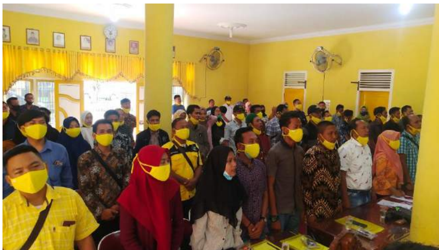
Foto kegiatan seminar yang diadakan DPD Partai Golkar Kabupaten Asahan