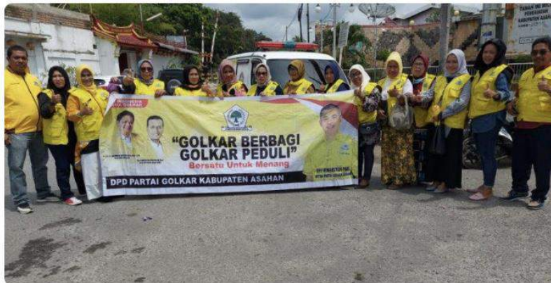
Foto kegiatan Jum'at berbagi "Golkar Berbagi Golkar Peduli" DPD Partai Golkar Kabupaten Asahan