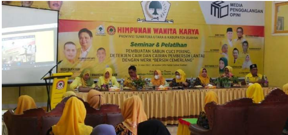
Foto kegiatan seminar dan pelatihan yang diadakan DPD Partai Golkar Kabupaten Asahan