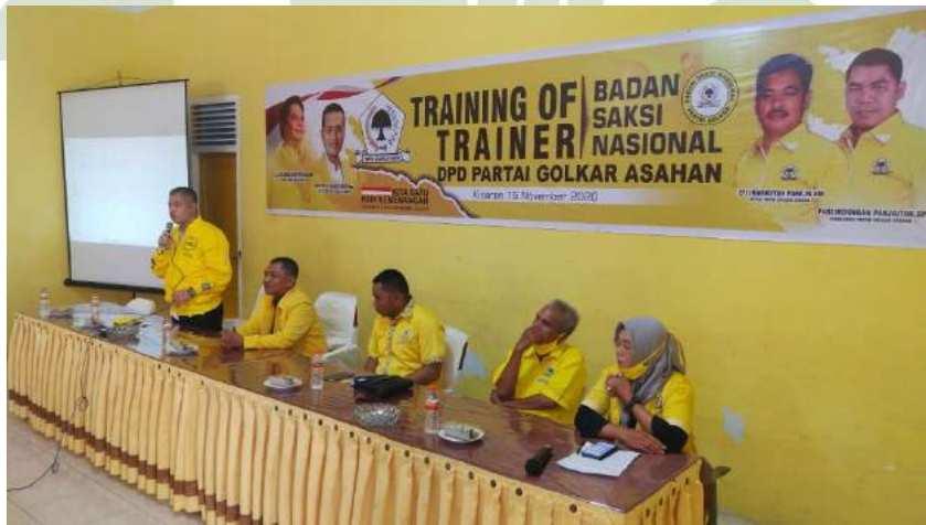
Foto kegiatan training of trainer yang diadakan DPD Partai Golkar Kabupaten Asahan