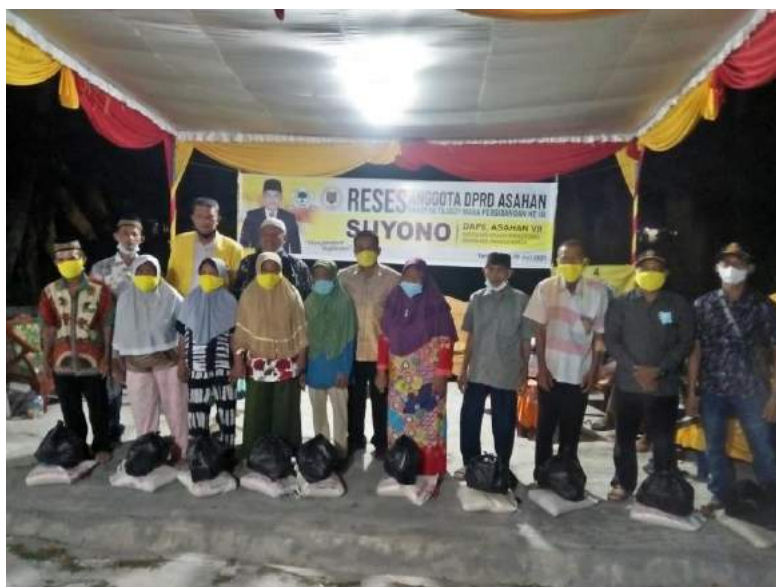
Foto kegiatan bakti sosial DPD Partai Golkar Kabupaten Asahan