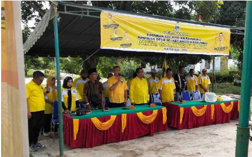
Foto pelantikan pimpinan kecamatan yang di adakan DPD Partai Golkar Kabupaten Asahan