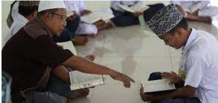
Gambar 7. Kegiatan Menghafal Al-Qur'an