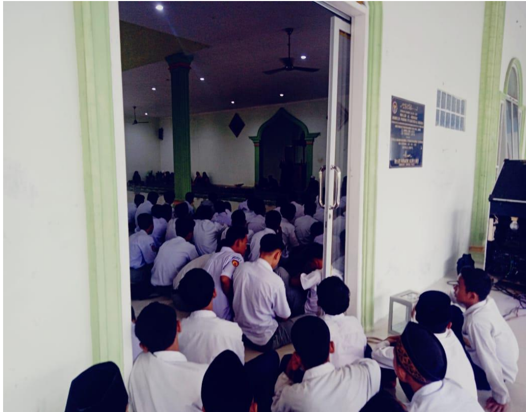
Gambar 5. Kegiatan Kajian Rutin dan juga Proses Bimbingan Keagamaan di Pondok Pesantren Al-Hidayah Desa Sei Mencirim Kabupaten Deli Serdang pada tanggal 05 Oktober 2022 Pukul 10.00 WIB