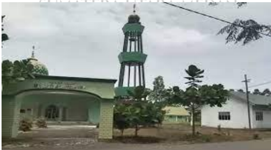
Gambar 9. Masjid Dan Asrama Pondok Pesantren Al-Hidayah