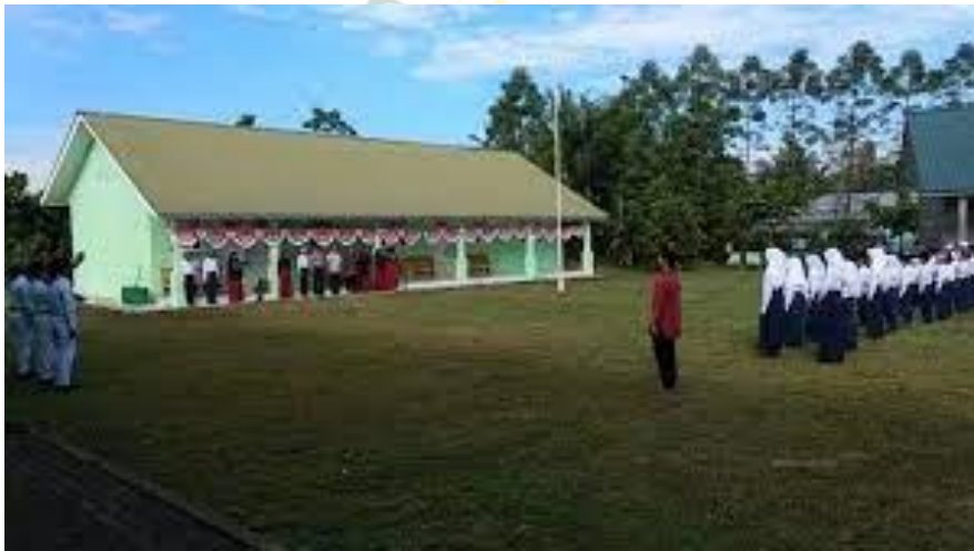
Gambar 8. Kegiatan Upacara Setiap Hari Senin