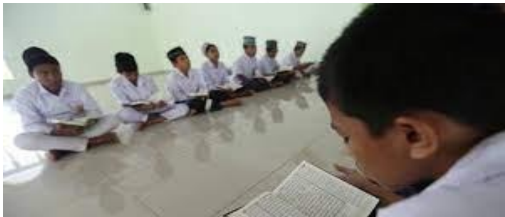
Gambar 6. Kegiatan Belajar Mengaji serta menghafal Al-quran di Masjid Pondok Pesantren Al-Hidayah Desa Sei Mencirim Kabupaten Deli Serdang Pada Tanggal 05 Oktober 2022 Pukul 15.00 WIB