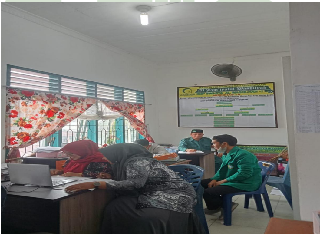
Berbincang-bincang di ruang guru