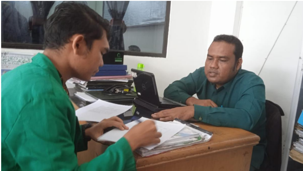
Wawancara bersama wakil kepala sekolah