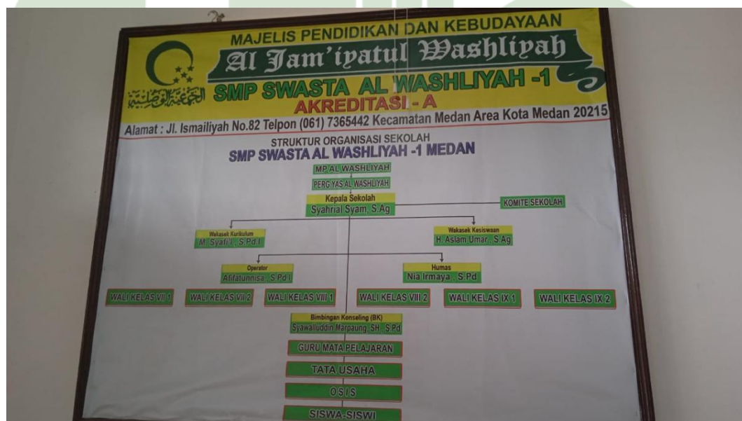
Struktur Organisasi Sekolah