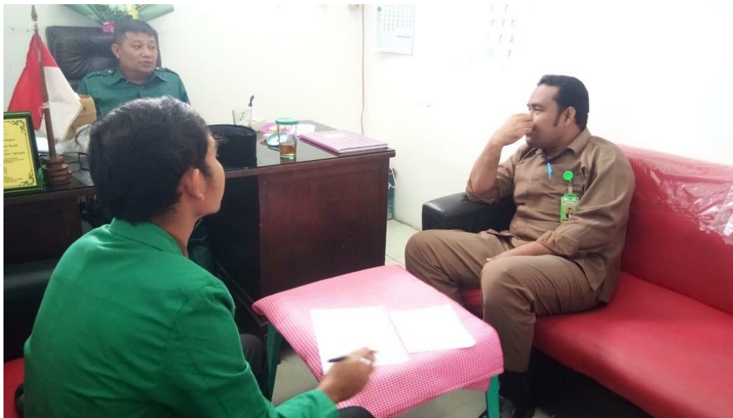
Wawancara bersama kepala sekolah