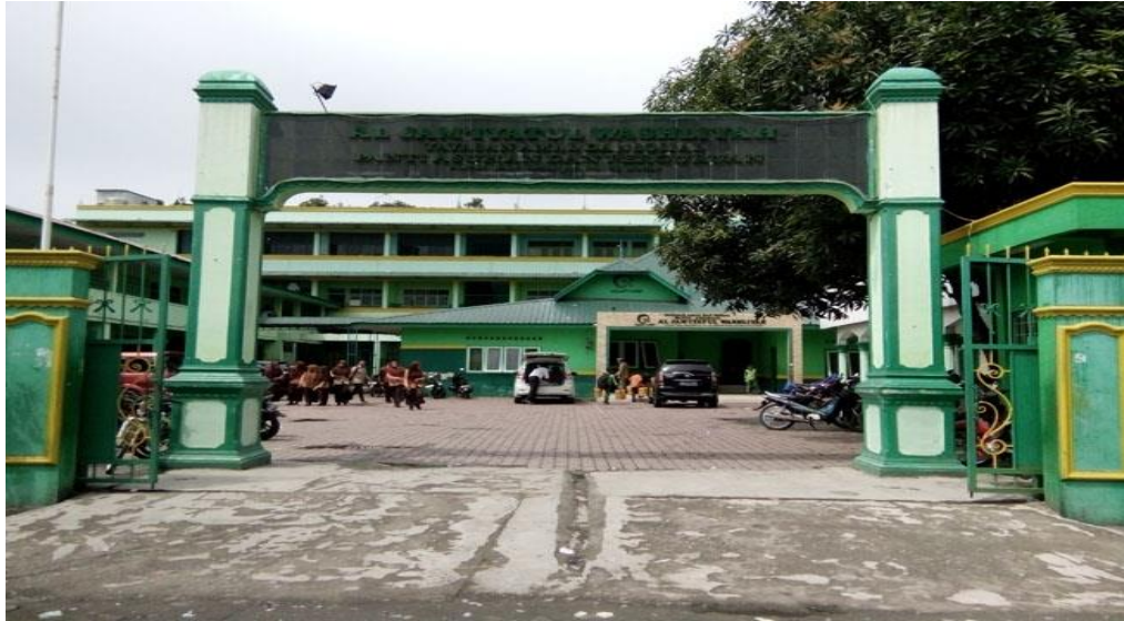
Bagian depan sekolah (gerbang sekolah)