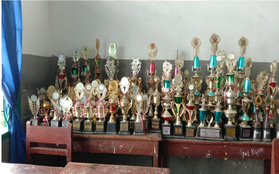
Prestasi yang diraih para siswa