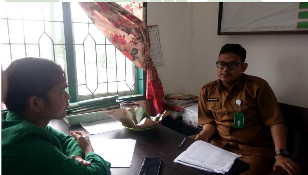
Wawancara bersama guru bidang study tahfiz