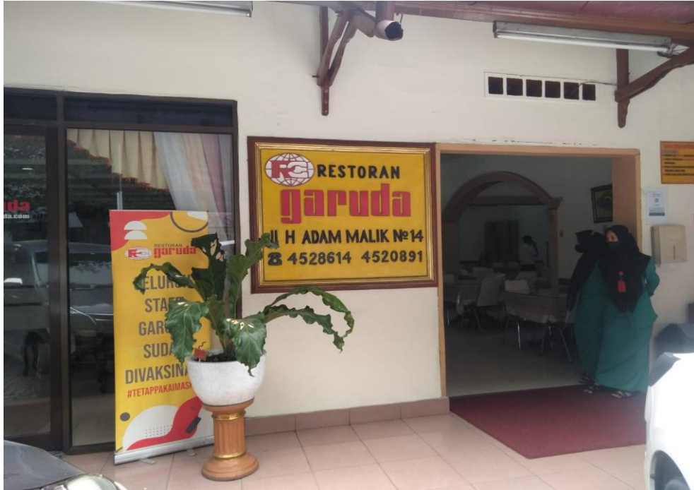
Foto Pintu Masuk Restoran Garuda Jl. H. Adam Malik No.14 Medan