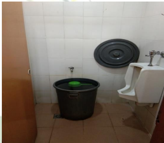
Foto Toilet Restoran Garuda

UNIVERSITAS ISLAM NEGERI SUMATERA UTARA MEDAN