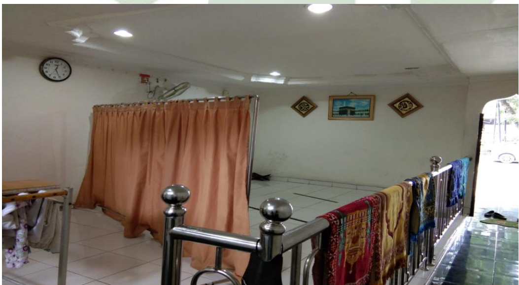
Foto Musholla Restoran Garuda