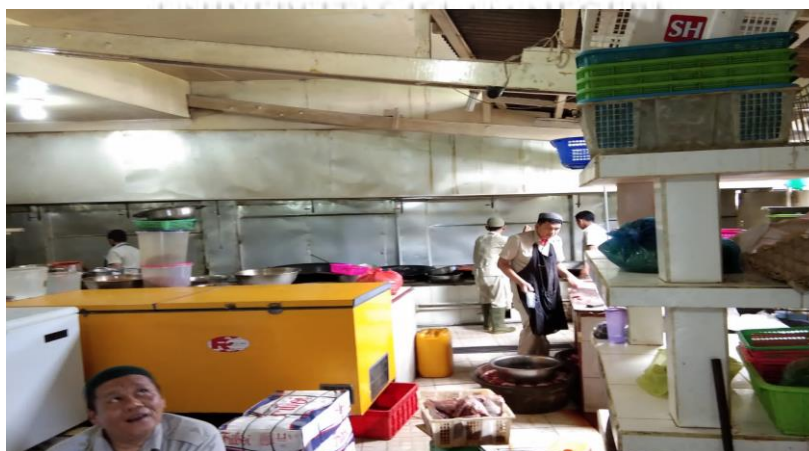
Foto Karyawan Restoran Garuda yang Sedang Bertugas Memotong dan Memasak