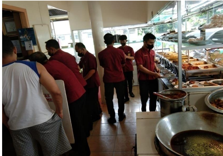
Foto Para Karyawan yang Sedang Bertugas Melayani Pembeli