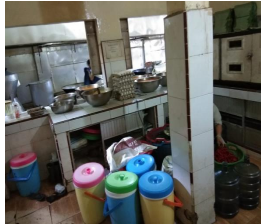
Foto Dapur Restoran Garuda