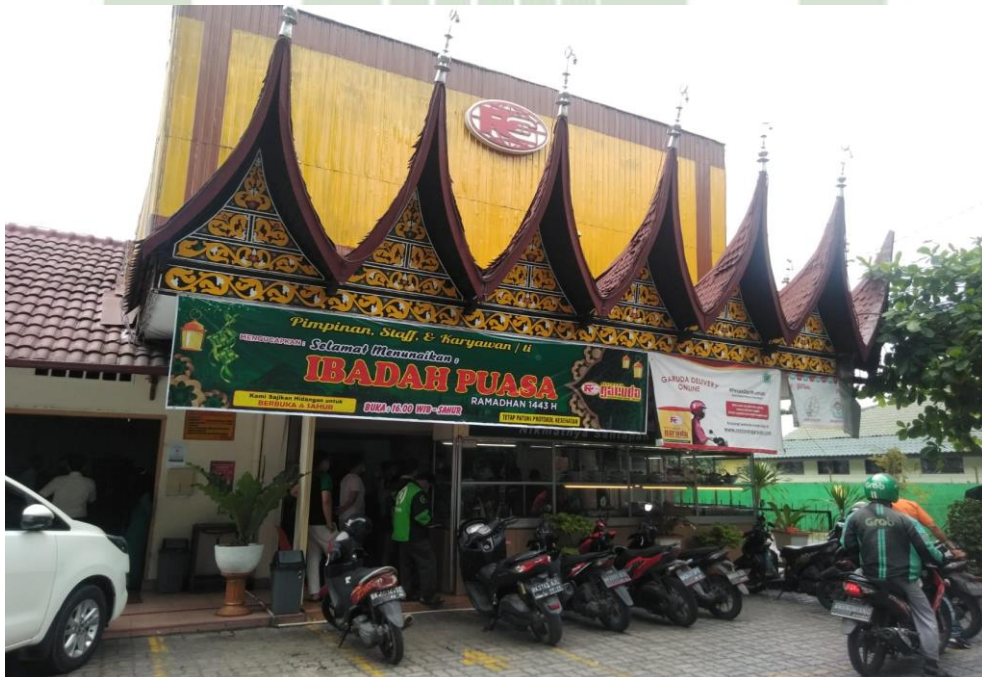
Foto Depan Restoran Garuda Jl. H. Adam Malik No.14 Medan