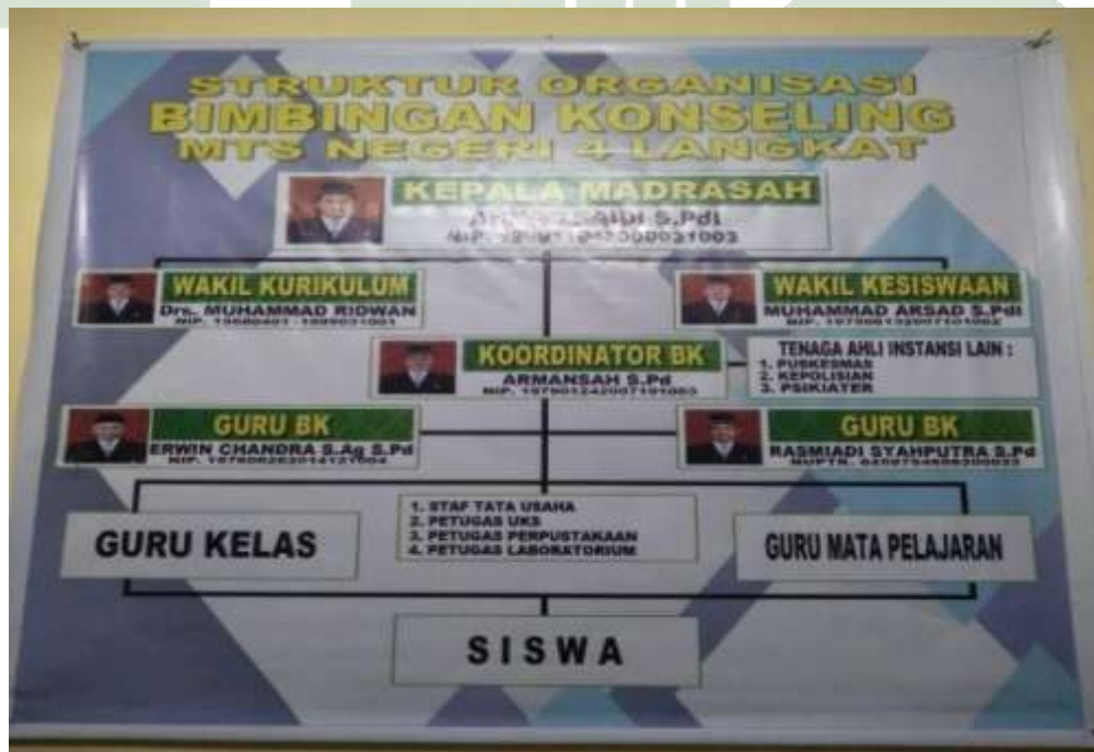
Struktur Organisasi BK di MTsN 4 Langkat