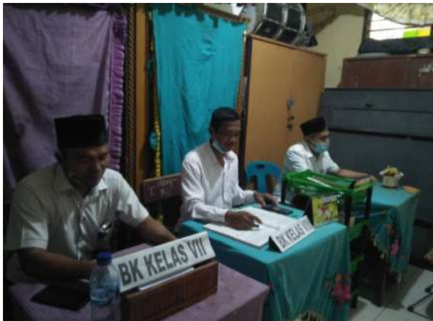
Guru BK kelas VII, VIII dan IX di MTs N 4 Langkat