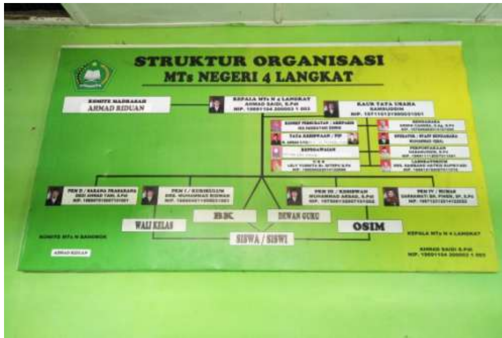
Struktur Organisasi MTsN 4 Langkat