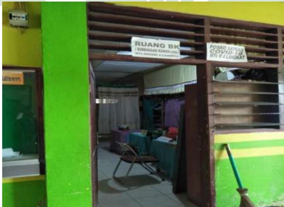
Ruang BK di MTsN 4 Langkat