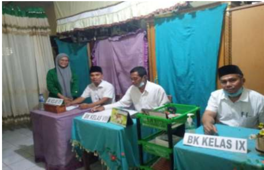
Foto Bersama dengan guru BK di MTs N 4 Langkat