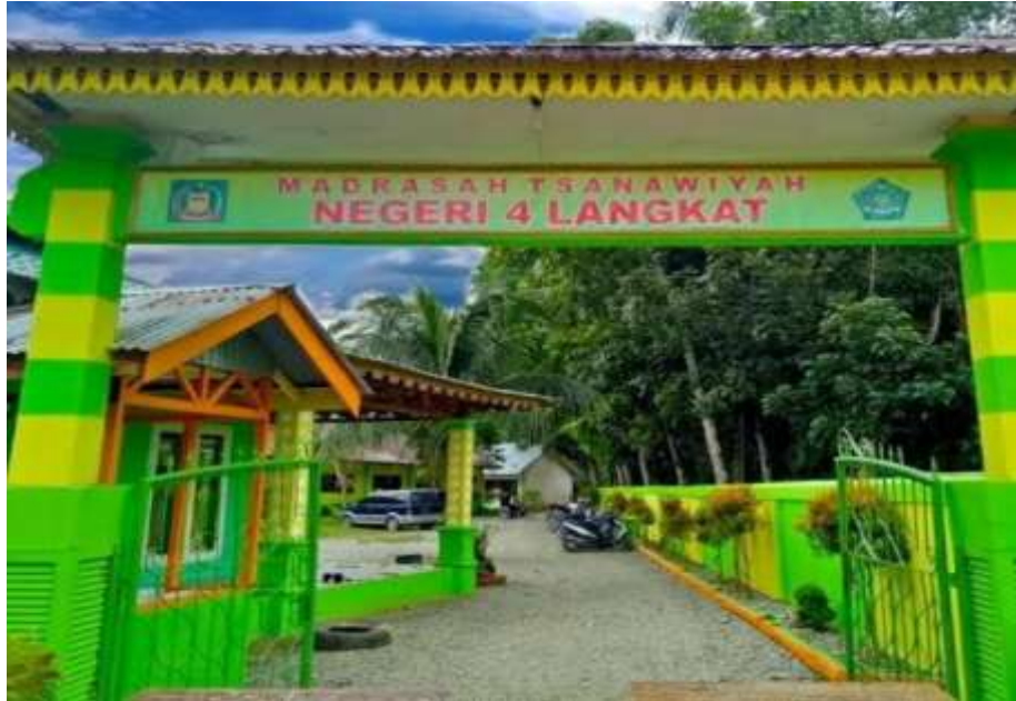
Gambar pintu masuk MTs N 4 Langkat