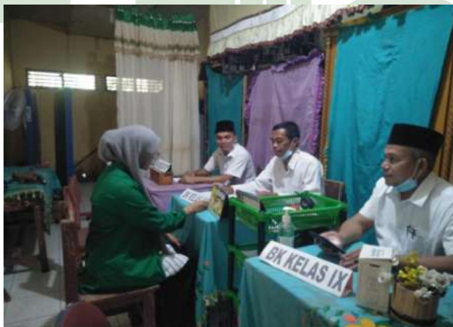
Wawancara dengan guru BK MTs N 4 Langkat