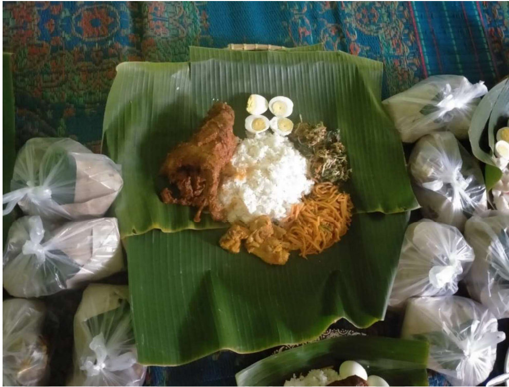
NASI AYAM INKGUNG