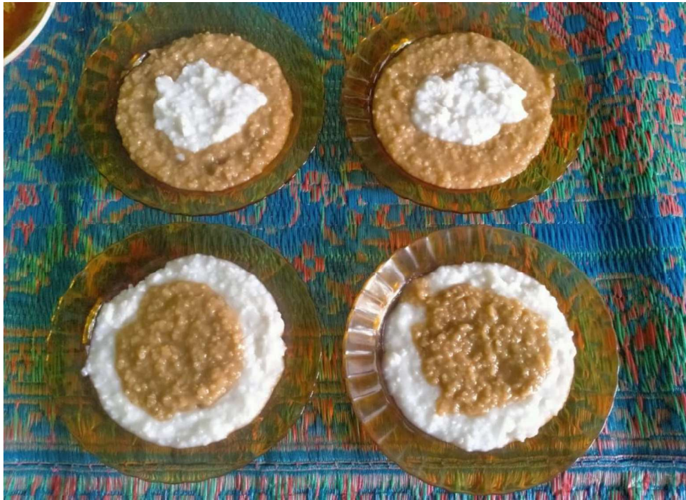
BUBUR MERAH PUTIH