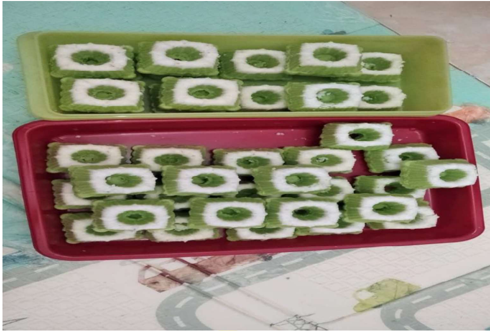
KUE PUTU AYU