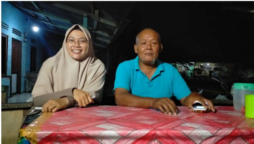
Wawancara dengan Bapak Bromo