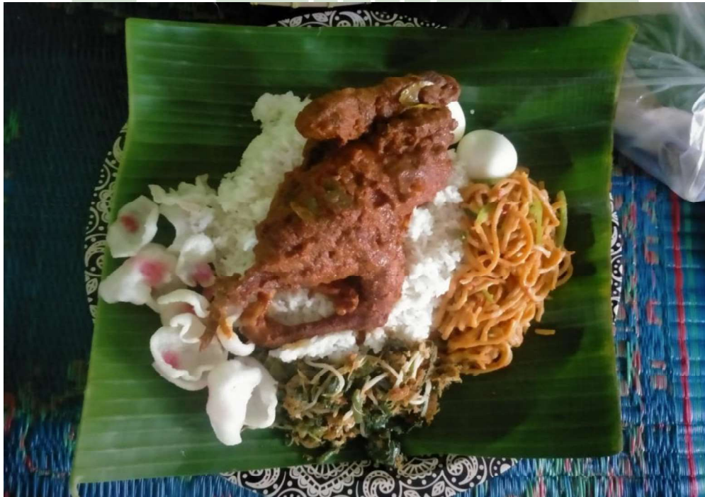
NASI AYAM INGKUNG