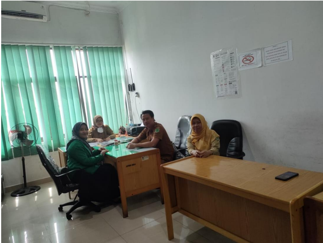
Foto Saat Wawancara di RSUD Aek Kanopan

UNIVERSITAS ISLAM NEGERI SUMATERA UTARA MEDAN