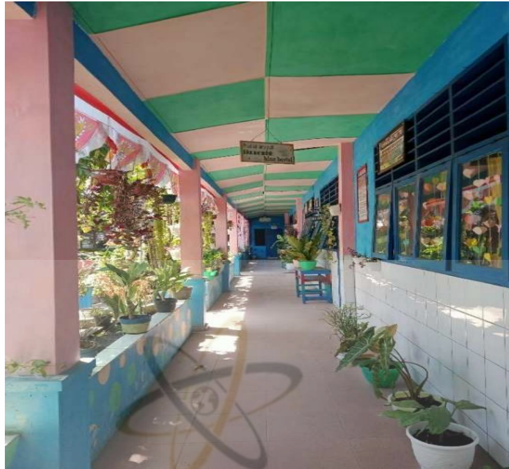
Gambar 2. Lingkungan SD Negeri 107403 Cinta Rakyat