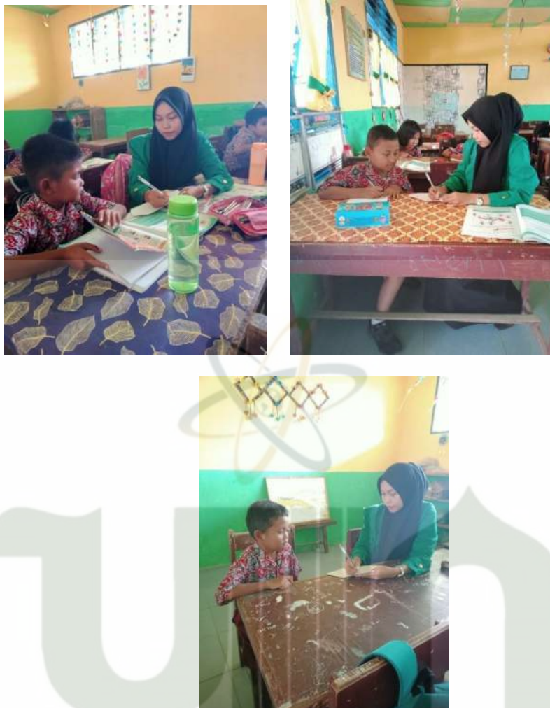
Gambar 7. Saat melakukan wawancara dengan siswa-siswi kelas 4 untuk mengetahui bagaimana motivasi belajar siswa di kelas.

UNIVERSITAS ISLAM NEGERI SUMATERA UTARA MEDAN