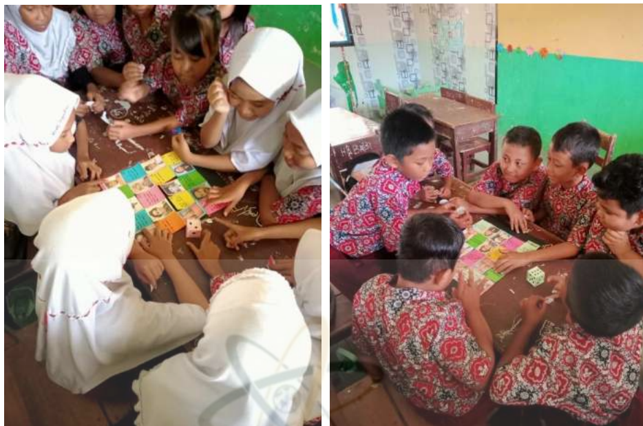
Gambar 4. Siswa sedang berdiskusi dengan permainan pembelajaran yang dilakukan oleh guru