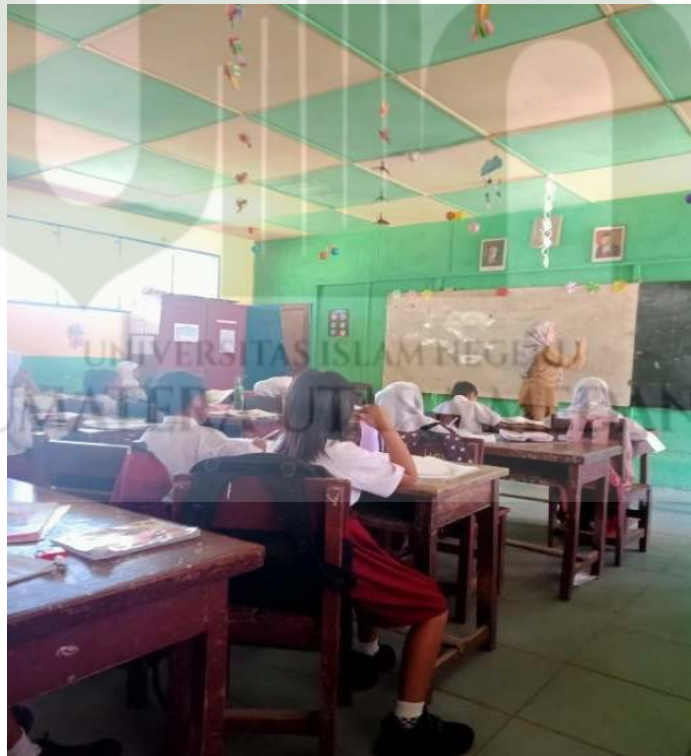
Gambar 3. Situasi Proses belajar mengajar dikelas