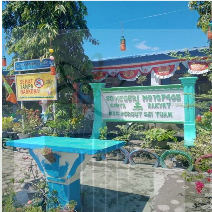
Gambar 1. Profil SD Negeri 107403 Cinta Rakyat