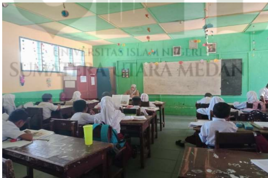
Gambar 5. Siswa sedang mengerjakan tugas yang diberikan oleh guru