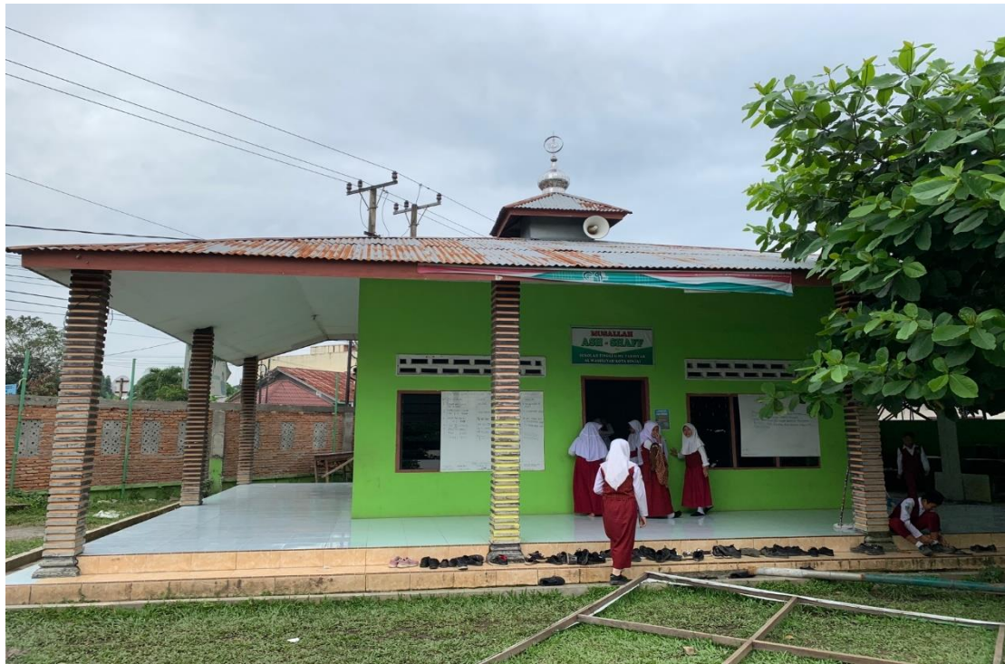
3.10 Mushola MIS Al-Wasliyah 48 Binjai