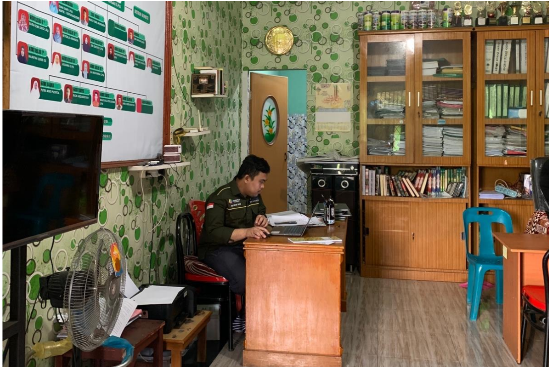
3.6 Ruang Kantor MIS Al-Wasliyah 48 Binjai