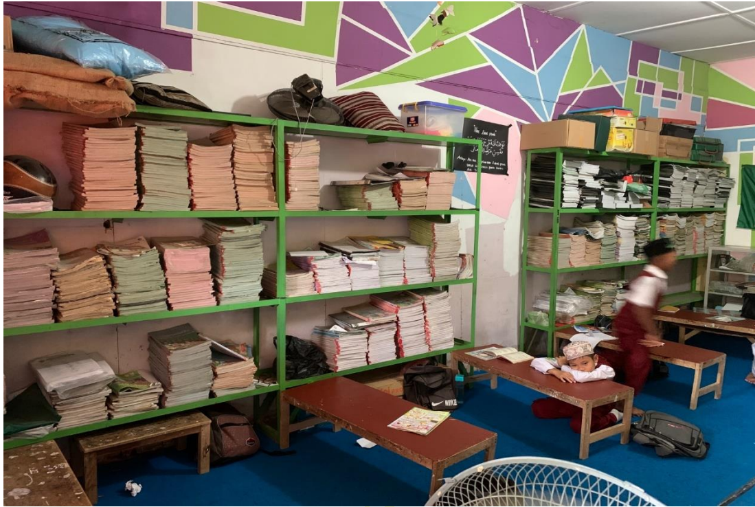
3.8 Ruang Perpustakaan MIS Al-Wasliyah 48 Binjai