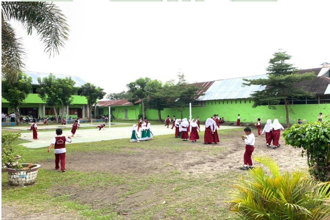
3.12 Lapangan MIS Al-Wasliyah 48 Binjai