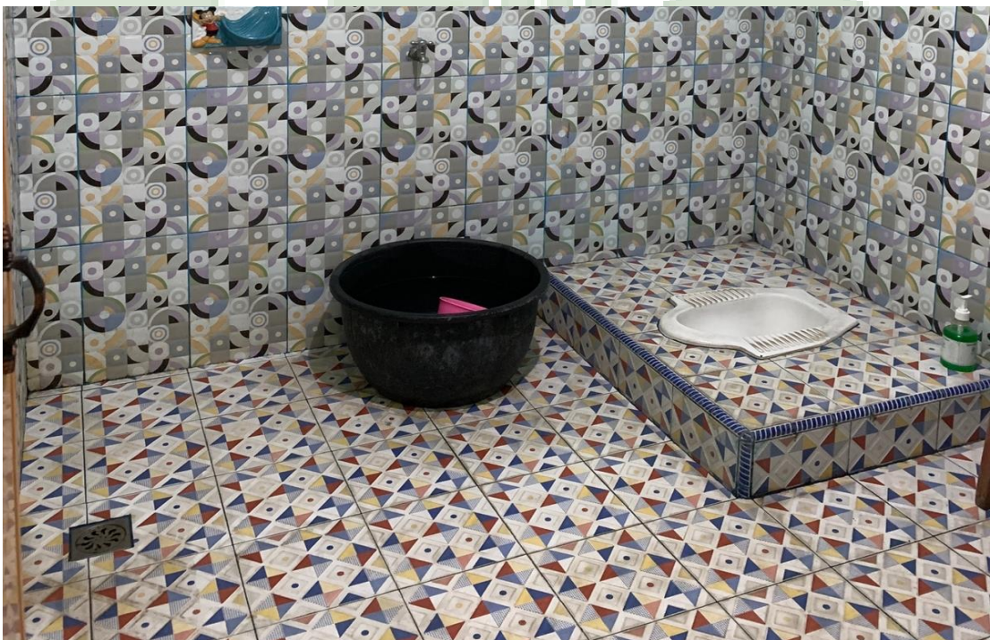
3.14 Toilet MIS Al-Wasliyah 48 Binjai