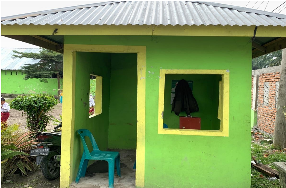
3.13 Pos Satpam MIS Al-Wasliyah 48 Binjai