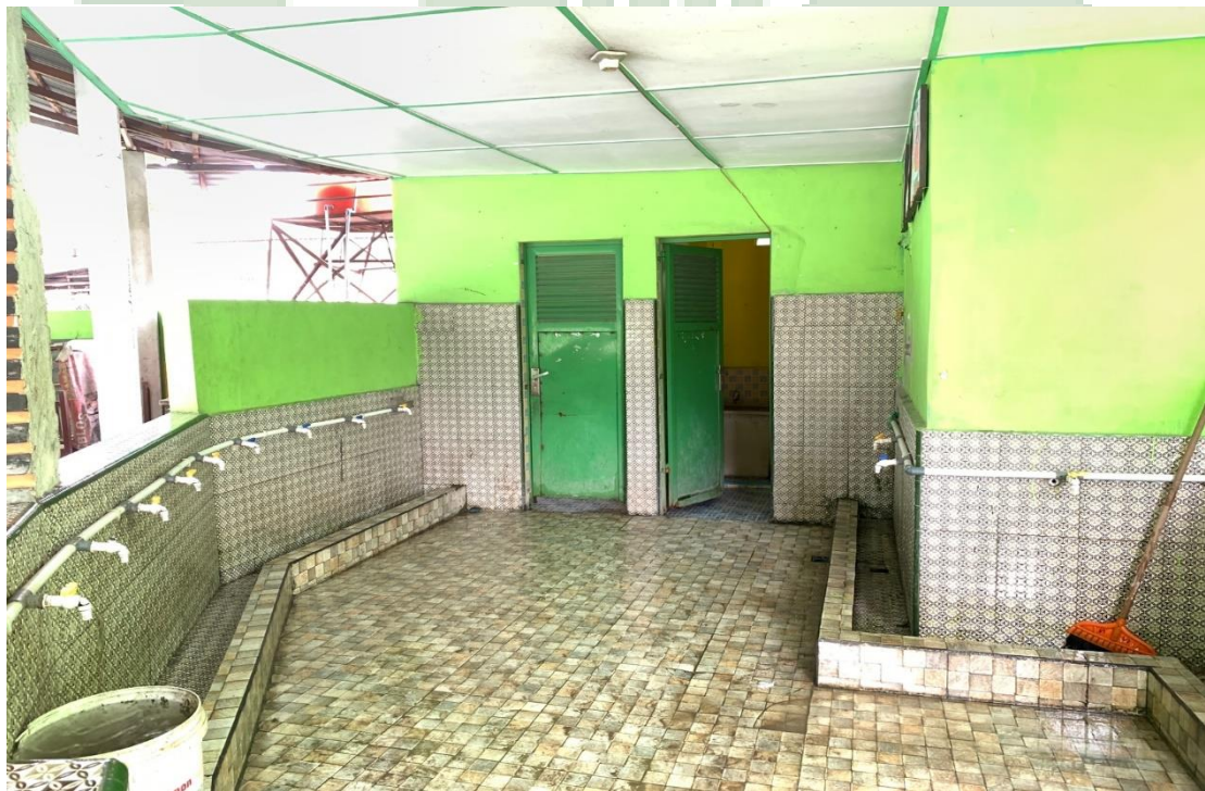
3.11 Tempat Wudhu MIS Al-Wasliyah 48 Binjai