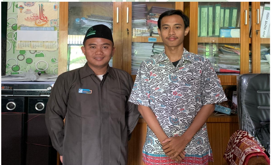
3.1 Foto Bersama Kepala MIS Al-Washliyah 48 Binjai