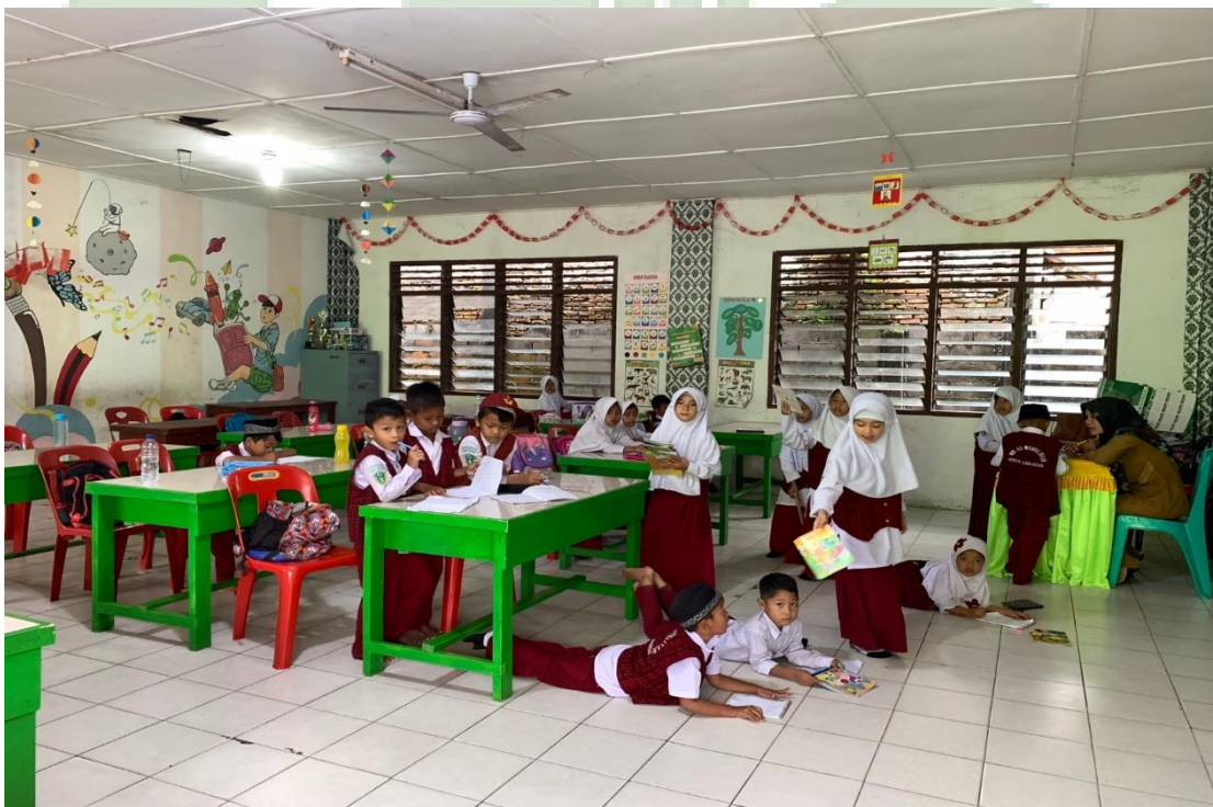
3.7 Ruang Kelas MIS Al-Wasliyah 48 Binjai