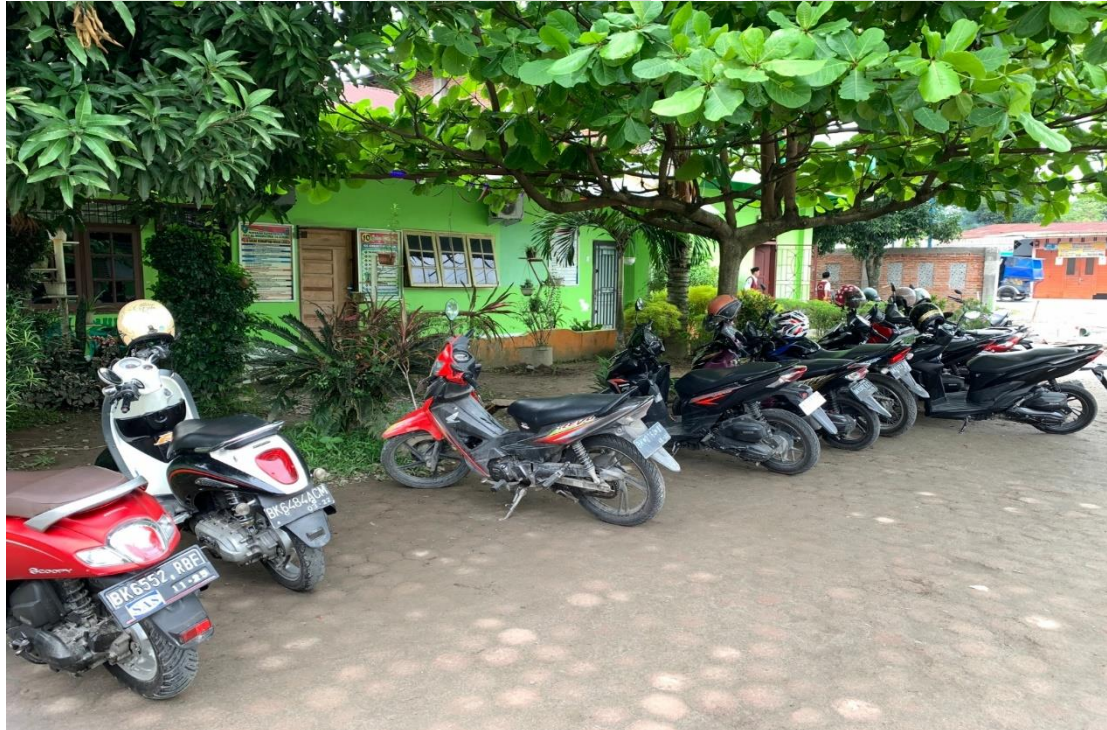
3.9 Parkiran MIS Al-Wasliyah 48 Binjai