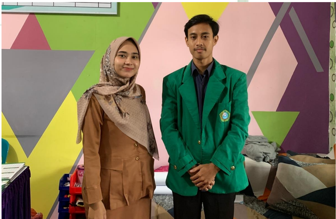
3.2 Foto Bersama Guru MIS Al-Washliyah 48 Binjai