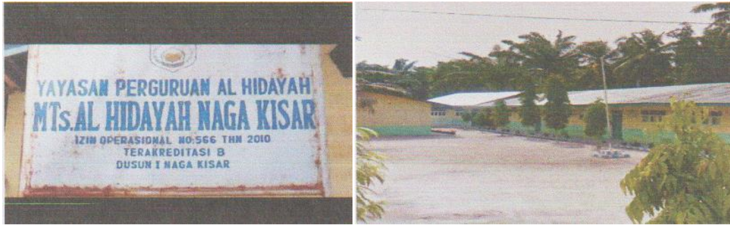
Halaman MTs Al Hidayah Naga Kisar Serdang Bedagai