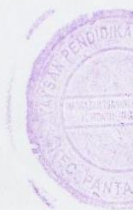
Prabudi Iman Syahputra, SH