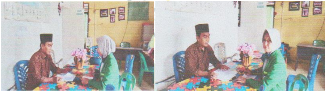
Wawancara dengan Kepala Madrasah