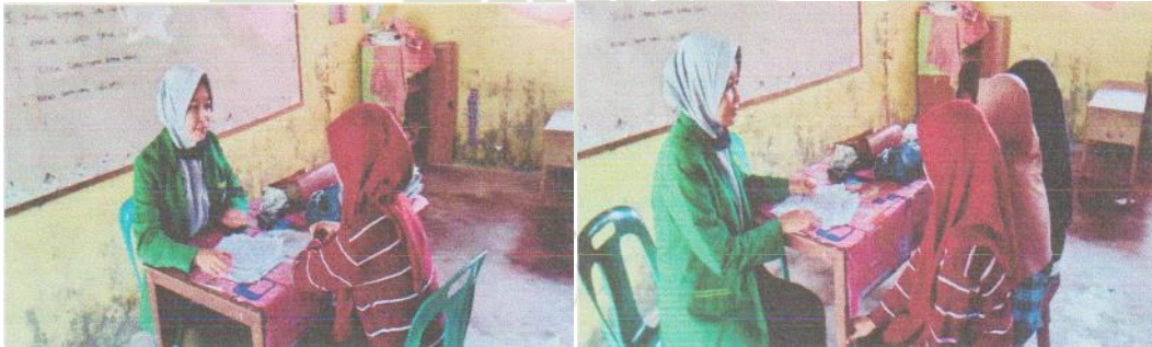
Wawancara dengan Siswi Kelas VIII MTs Al Hidayah