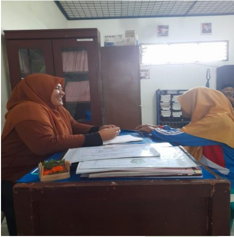
Gambar 7. Konseling Individu