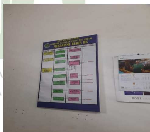
Gambar 4. Struktur Mekanisme Kerja BK