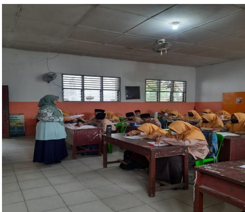
Gambar 5. Pemberian Layanan