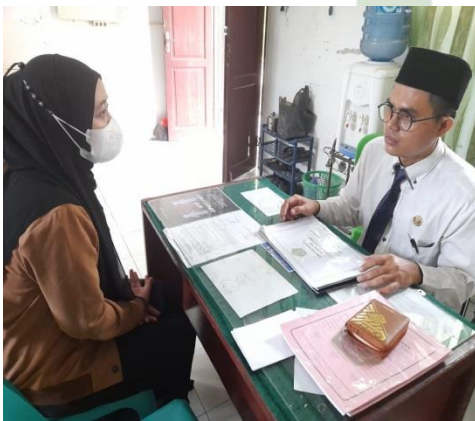
Gambar 9. Wawancara Dengan Guru BK