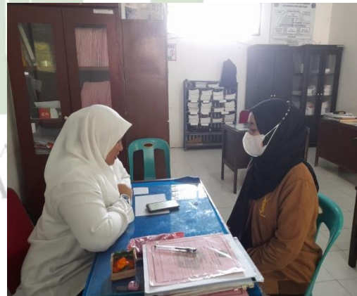
Gambar 10. Wawancara dengan guru bk