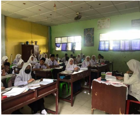
Gambar 1. Ruang Belajar Siswa