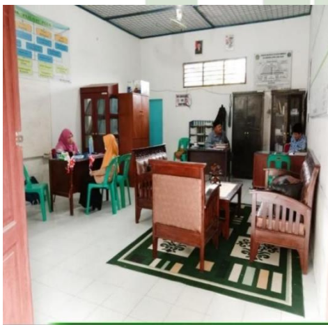
Gambar 3. Ruangan BK