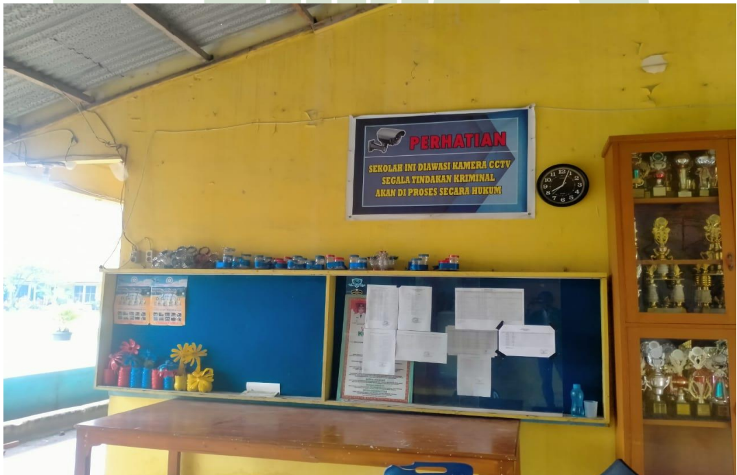
2.10. Tempat Satpam SMPN 35 Medan