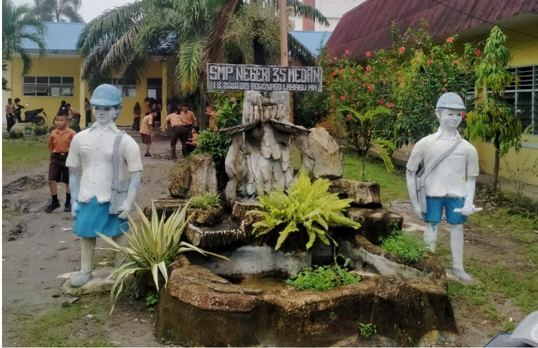
2.7. Taman SMPN 35 Medan