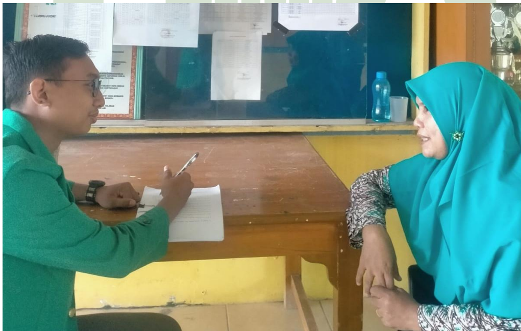
2.2. Wawancara Guru SMPN 35 Medan