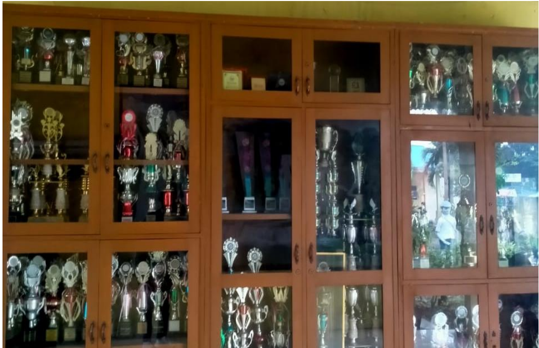
2.11. Penghargaan SMPN 35 Medan