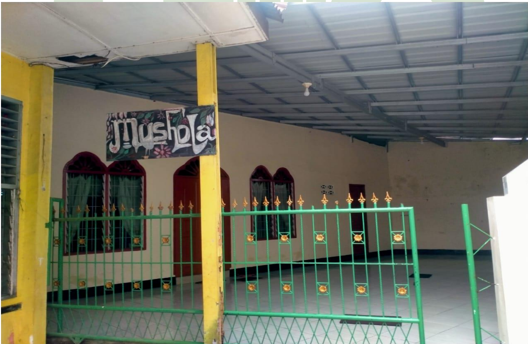
2.8. Mushollah SMPN 35 Medan