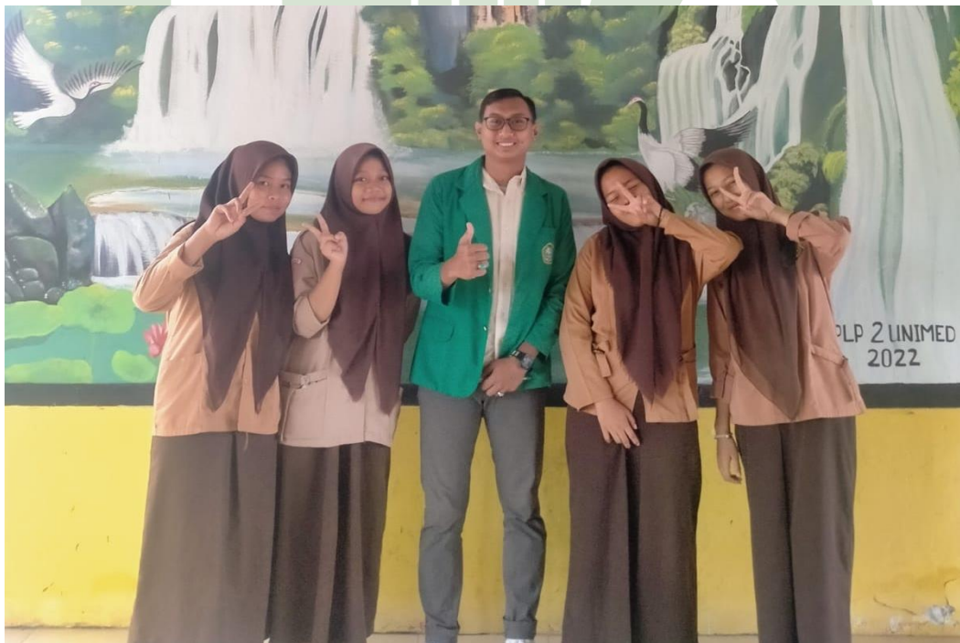
2.4. Foto Bersama Siswa SMPN 35 Medan