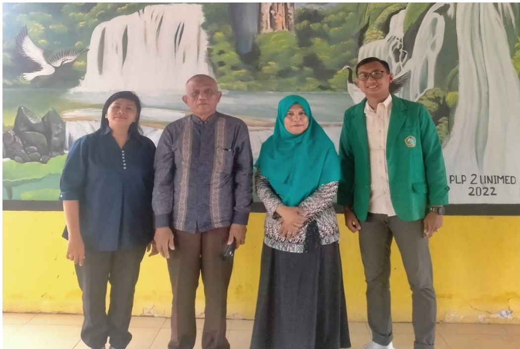
2.5. Foto Bersama Guru SMPN 35 Medan