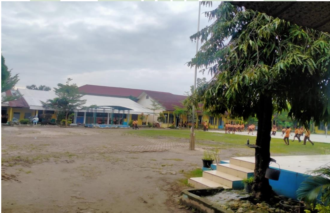
2.6. Lapangan SMPN 35 Medan