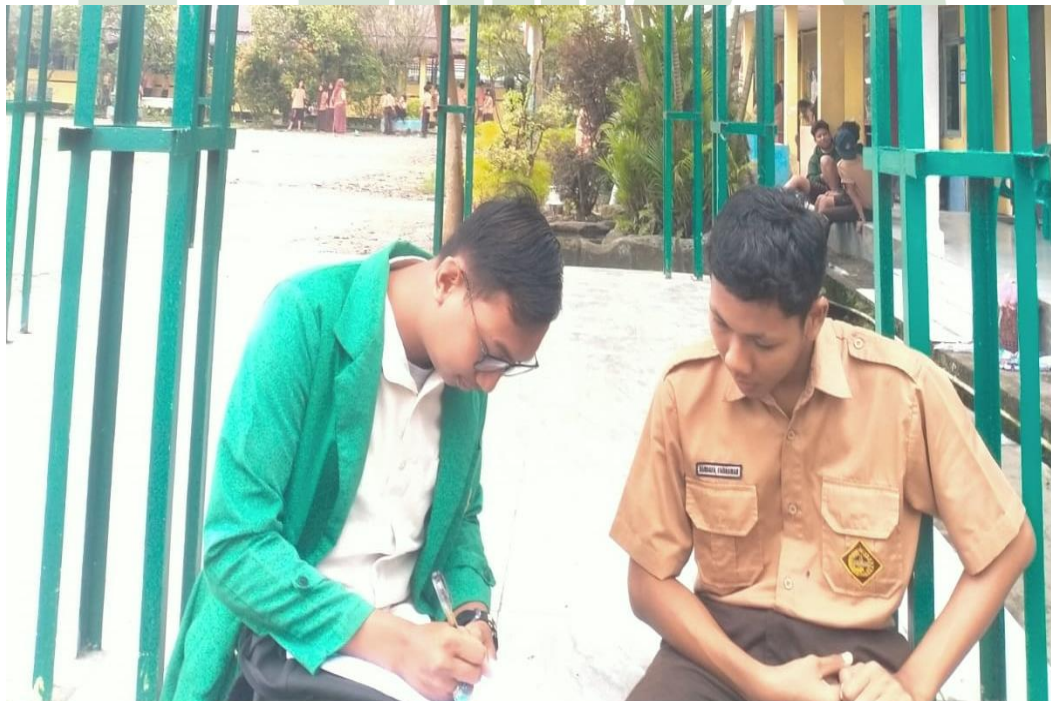
2.3.Wawancara Siswa SMPN 35 Medan