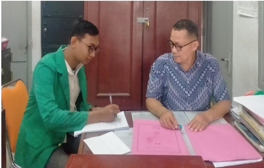
2.1. Wawancara Kepala SMPN 35 Medan