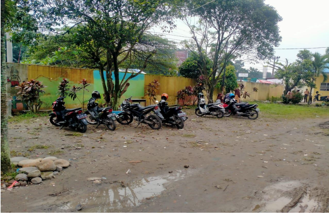
2.9. Tempat Parkir SMPN 35 Medan