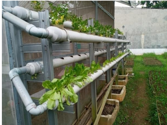
Menanam dengan sistem hidroponik