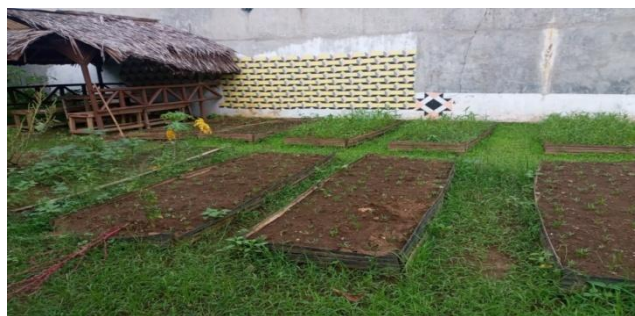
Demplot untuk menanam tanaman yang sebelumnya telah dibenihkan terlebih dahulu

UNIVERSITAS ISLAM NEGERI rumah bibit untuk membenih bibit SUMATERA UTARA MEDAN