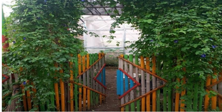
Pintu masuk ladang kelompok Melati yang ditumbuhi oleh bunga telang (obat)