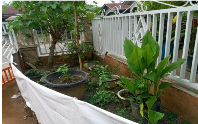
pekarangan rumah ibukSadinem