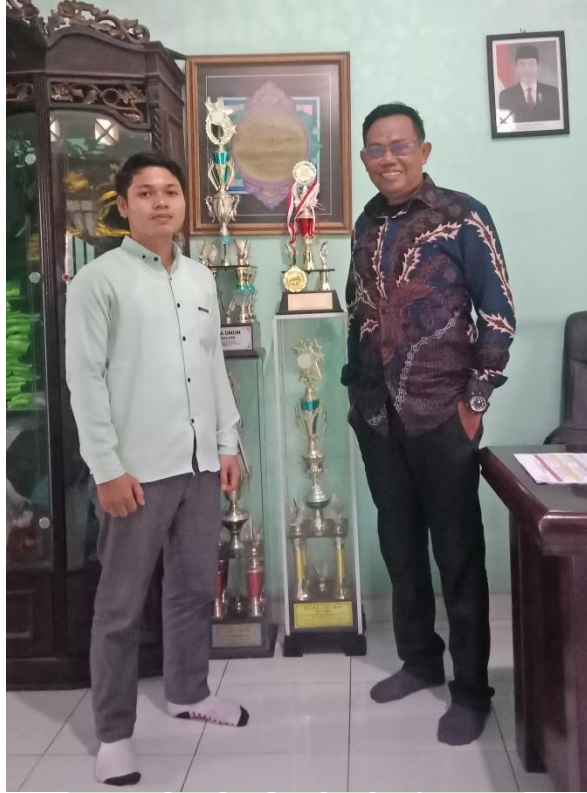
Foto Bersama Kepala Sekolah Mts Al Manar Tembung