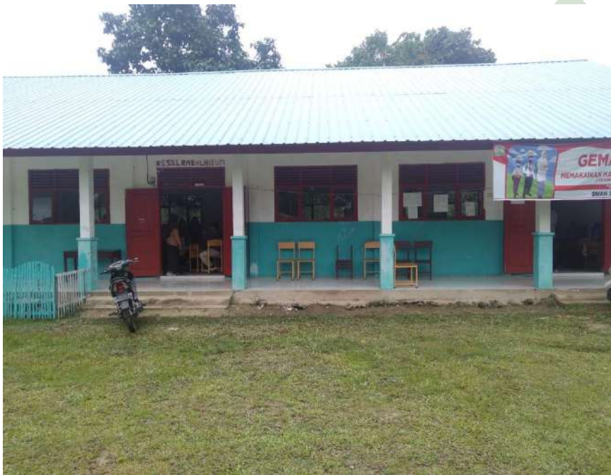
Foto ruangan kelas