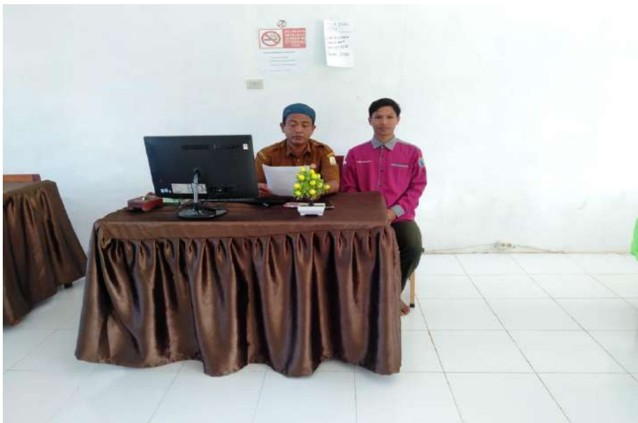
Foto Bersama Kepala Sekolah