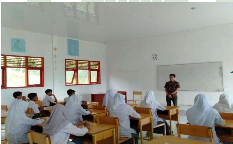
Foto mensosialisasikan kepada siswa