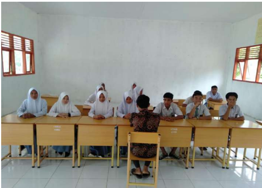
Wawancara dengan Siswa