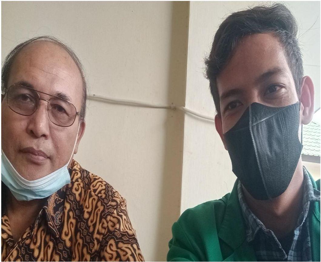
FOTO WAWANCARA BERSAMA HAKIM PENGADILAN AGAMA MEDAN KELAS IA