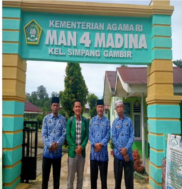
Photo Bersama Guru-guru Konseling di MAN 4 Mandailing Natal