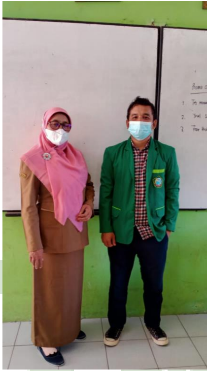
Gambar 3 Bersama Wali Kelas