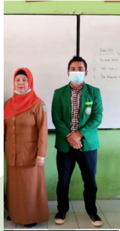
Gambar 4 Bersama Guru BK SMA N 5 BINJAI