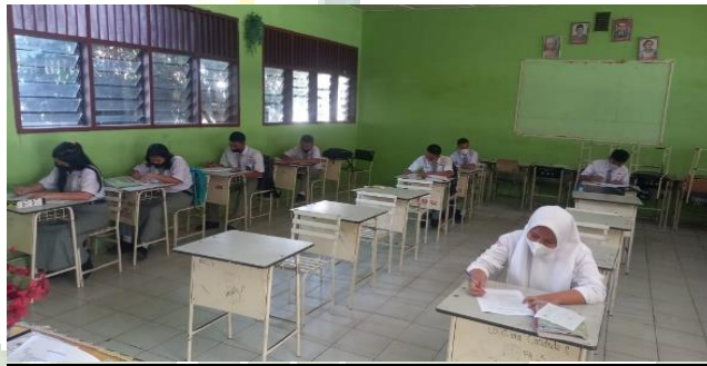
Gambar 6 Saat Pengerjaan Angket

UNIVERSITAS SAMUDRA SUMATERA UTARA MEDAN