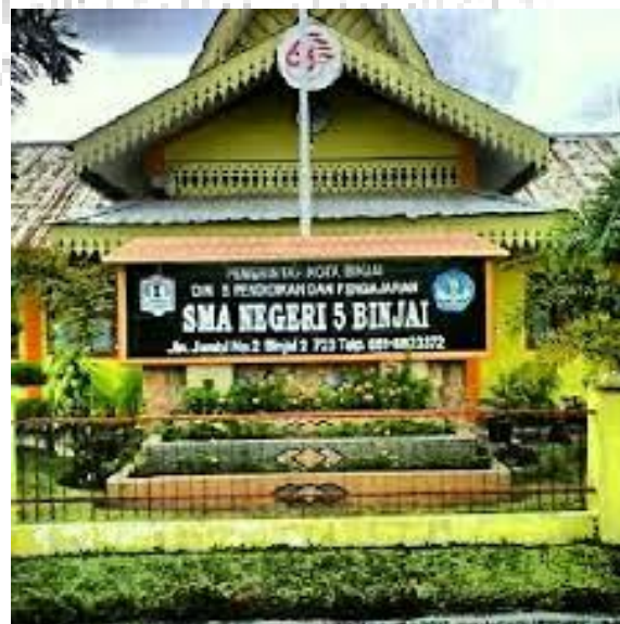
Gambar 5 SMA Negeri 5 Tampak Depan