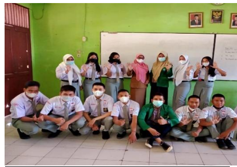
Gambar 7 Bersama dengan wali kelas dan siswa SMA N 5 Binjai