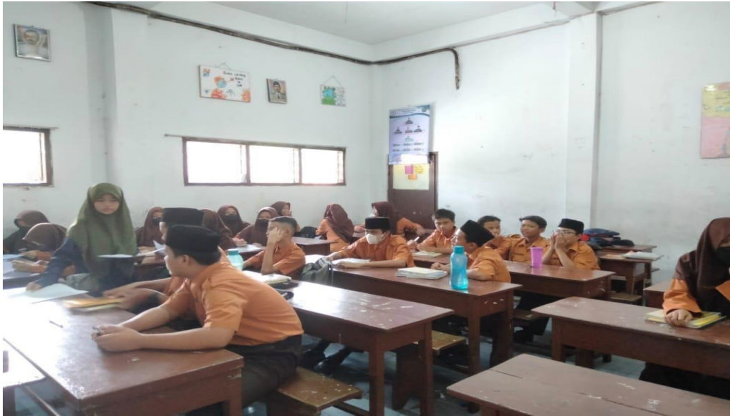
Penyebaran Angket Sebelum Melakukan Kegiatan PTBK