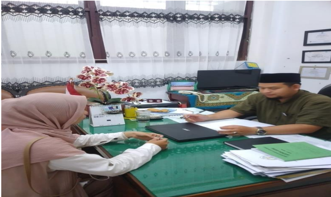
Foto bersama Kepala Sekolah MTS Al-Ulum Medan