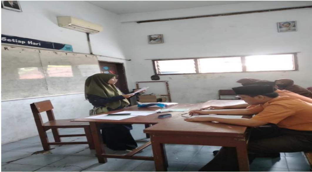
Pemberian Layanan konseling Kelompok