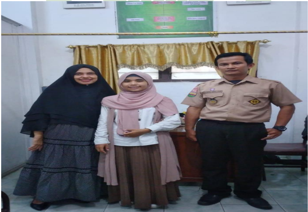
Foto bersama Guru Bk MTS Al-Ulum Medan