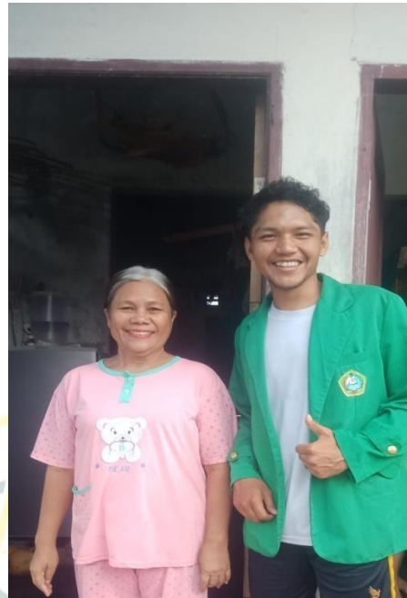
Dokumentasi selesai melakukan wawancara dengan Masyarakat Desa Belinteng Bik Leha Ketaren