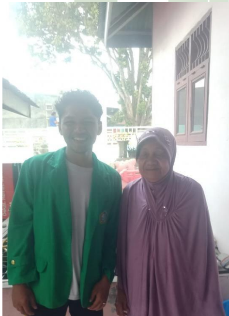
Dokumentasi selesai melakukan wawancara dengan Masyarakat Desa Belinteng Nondong Paini Br.Sembiring