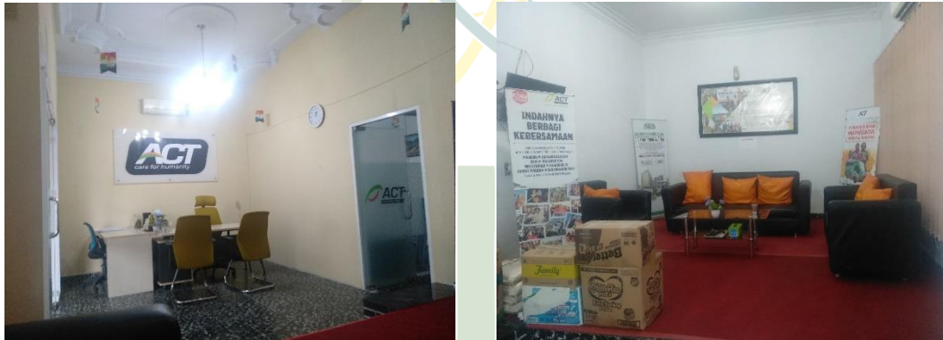
Kantor Aksi Cepat Tanggap Cabang Sumatera Utara (ACT Sumut) bagian luar dan dalam kantor