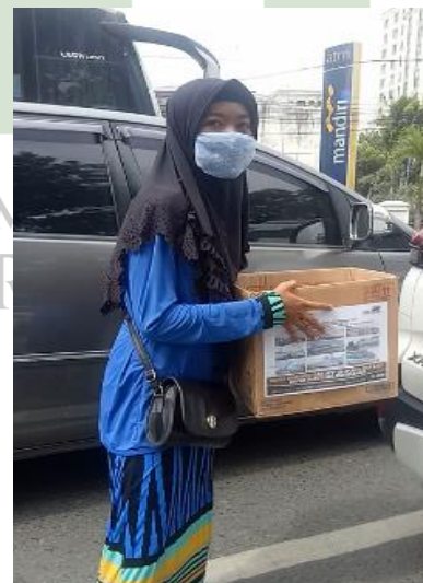
Penggalangan dana untuk korban bencana alam yakni gempa bumi di Majene, Sulawesi Selatan dan banjir di Kalimantan Barat