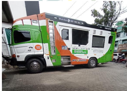
Food Truck ACT untuk membagi makanan kepada orang-orang yang membutuhkan