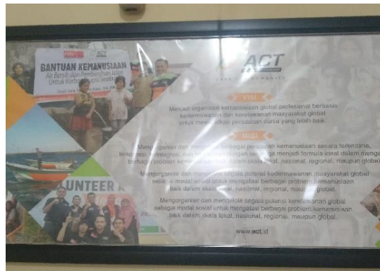
Visi dan Misi Aksi Cepat Tanggap (ACT)