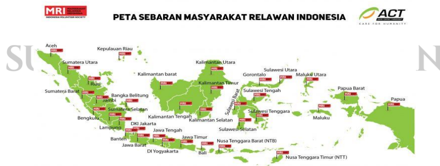
Peta cabang-cabang MRI ACT yang tersebar di seluruh Indonesia