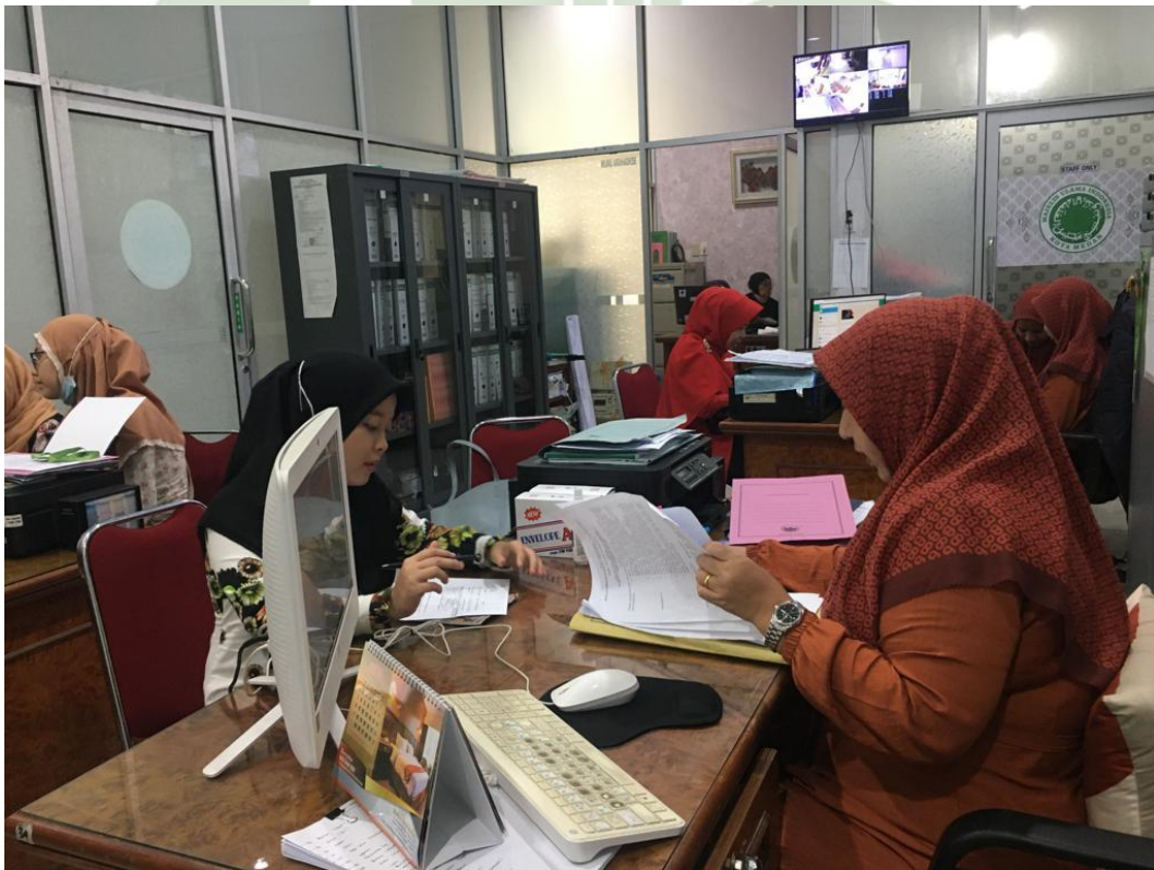
Keterangan: Dokumentasi Bersama staff Kantor MUI Medan.