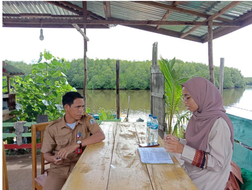
Wawancara dengan Bidang Perikanan dan Budidaya