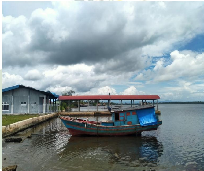
Kapal hasil Program Dinas Kelautan dan Perikanan