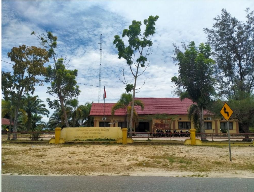
Kantor Dinas Perikanan dan Kelautan Kabupaten Aceh Singkil