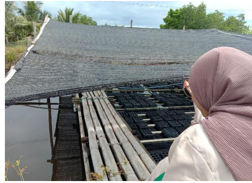
Jaring, kerambah, pipa hasil Program Dinas Kelautan dan Perikanan