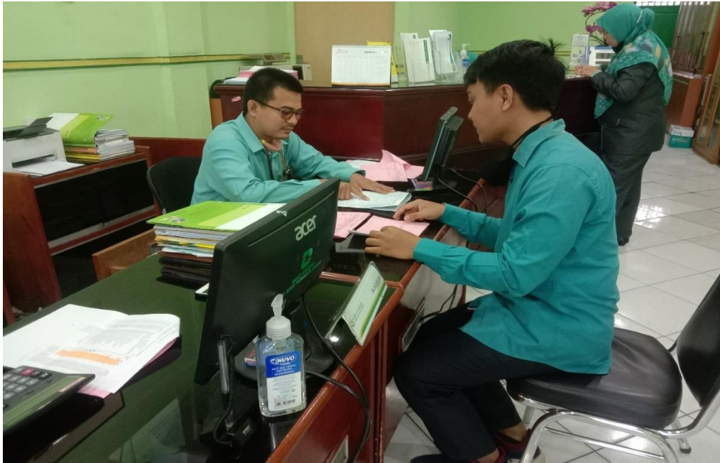
Gambar 1: Foto bersama Account Officer BPRS Puduarta Insani