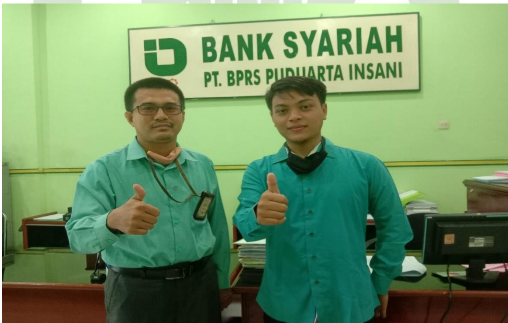
Gambar 2: Foto bersama Account Officer BPRS Puduarta Insani