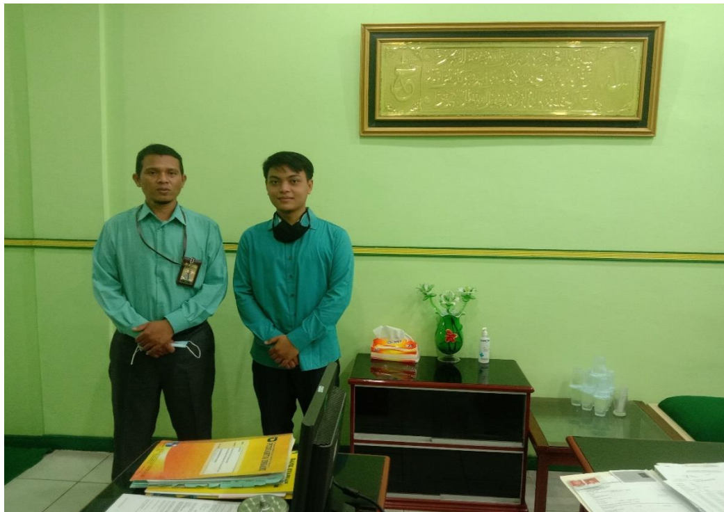
Gambar 3: Foto Bersama ADM pembiayaan BPRS Puduarta Insani